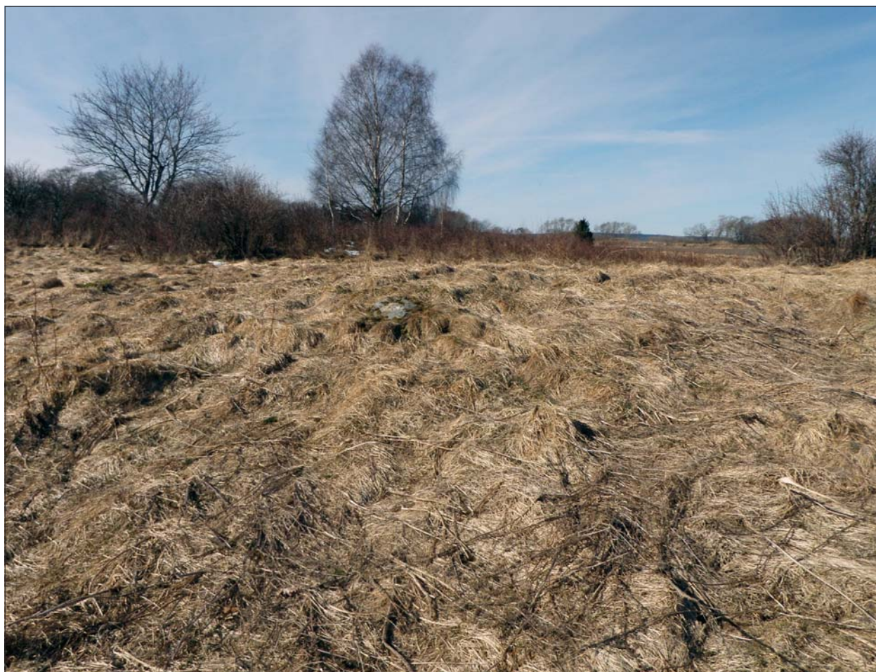
Figur 6. Låg rund stensättning på gravfältet RAÄ 111.

Däremot iaktogs stengrunden till en utlada i gravfältets västra del. Denna bestod av på berget direkt lagda, ca 1 m i diameter stora och huggna, stenar vilka stod i gles formation och bildade en rektangel.