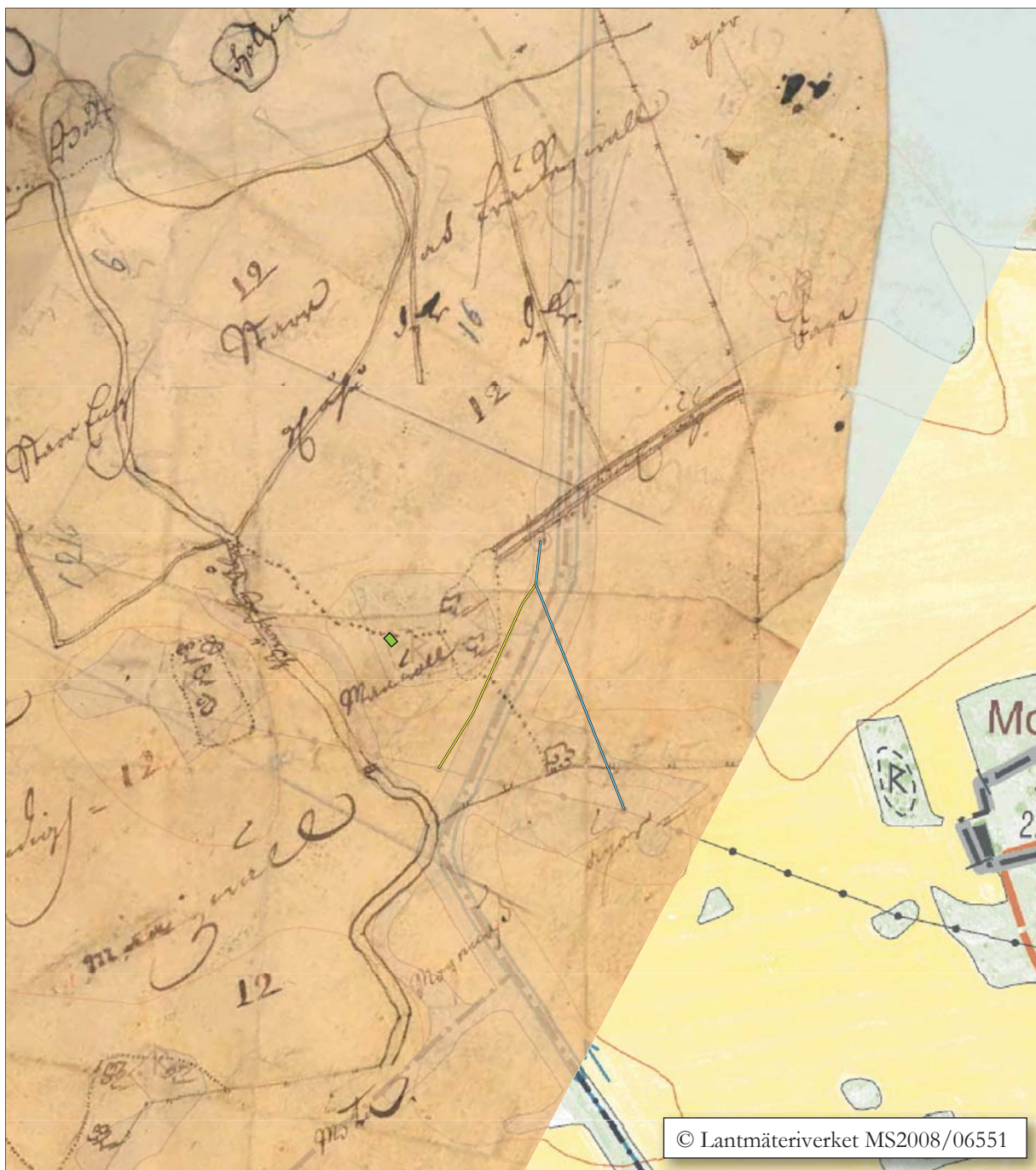
Figur 4. Utdrag ur handling 05-rjs-4 i LMM arkiv. Undersökningsområdet är beläget i betesmarken direkt öster om ån.

Gården omnämns 1322, då den förlänades till riddaren Knut Mattiasson ( www.riksarkivet.se SDHK 9515). Brevet är undertecknat av hela rikets råd, bland andra biskop Olof i Uppsala, drotten Knut Johansson,