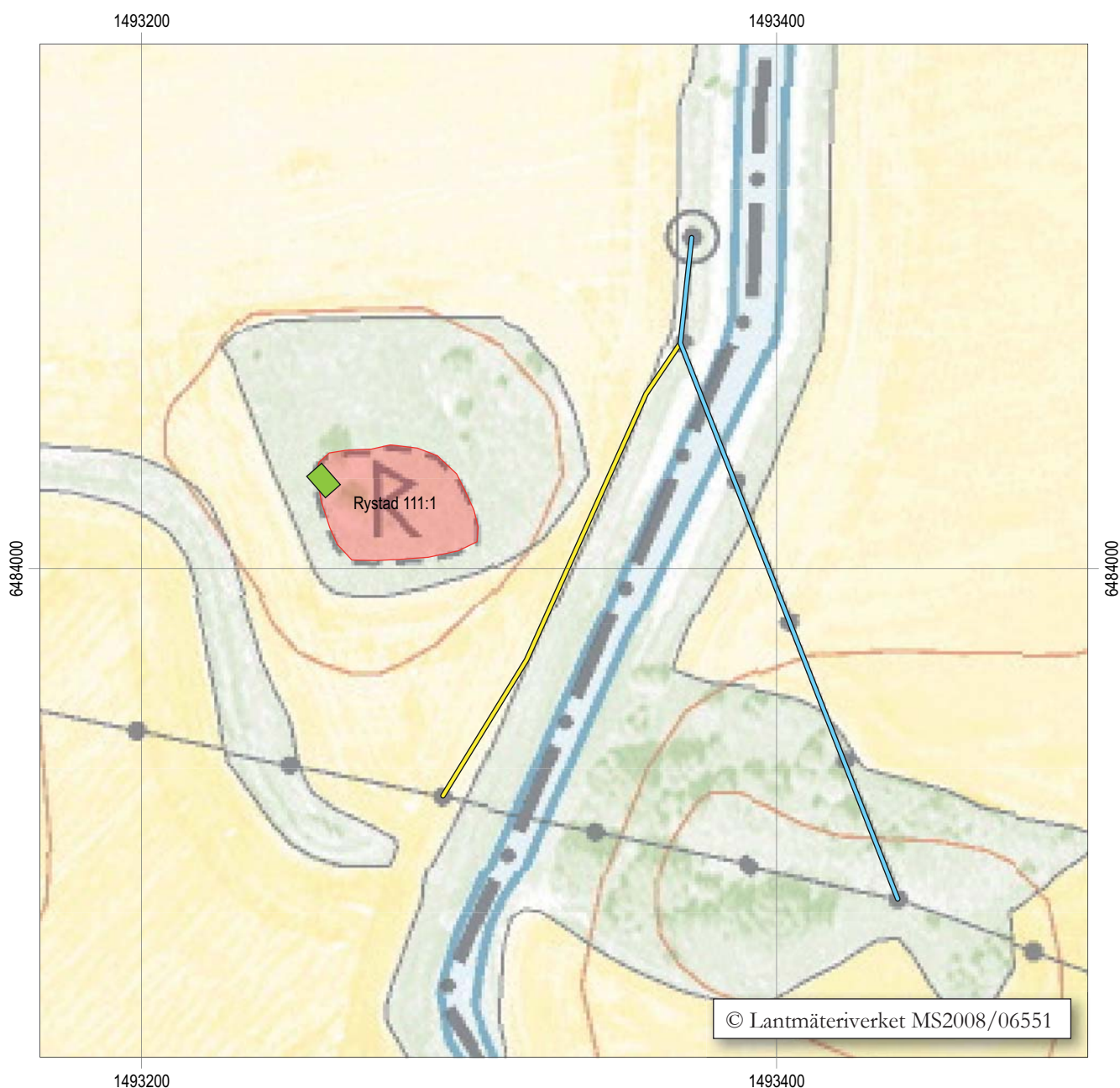
Figur 4. Utdrag ur digitala fastighetskartan, blad 8F 6i. Blå markering är rasering av befintlig luftledning, gul markering är ny jordkabel och grön markering är en husgrund. Skala 1:2000.

De äldsta fornlämningarna i området kan dateras till sten/bronsålder och består av en fyndplats för en stenyxa av grönsten och två skålgropsförekomster (RAÅ 278 och 279). På de låga uppstickande impedimenten öster om gården ligger två gravfält, RAÅ 111 och 112, som