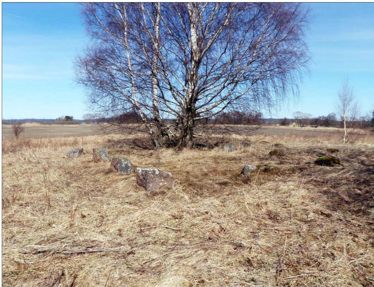
Figur 7. Nyuppäckt grund till utlada bestående av en rektangel med buggen sten.