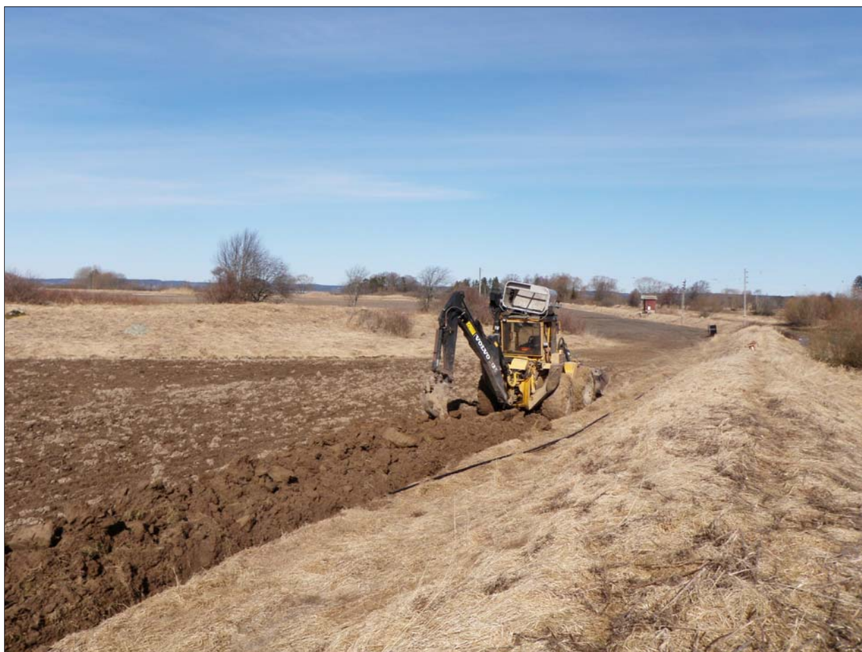
Figur 5. Pågående arbete. Invallningen av ån i förgrunden. Gravfältet RAA 111 till vänster i bakgrunden.

Gården ligger på en kulle i den omgivande slätten och tidigare var denna kulle omfluten av vatten. Gården har tidigare haft byggnader på alla fyra sidor, men det äldsta kända huset, det så kallade kungshuset, se ovan, är nu borta. Av dagens hus är "Stora stenhuset" uppfört 1644 men kraftigt ombyggt 1753. "Lilla Stenhuset" är uppfört 1648-52 och har bland annat takmålningar från mitten av 1600-talet. Huset präglas dock främst av en ombyggnad 1926. Arrendatorsbostaden väster om gården är från mitten av 1800-talet (uppgifter från www.sfv.se )