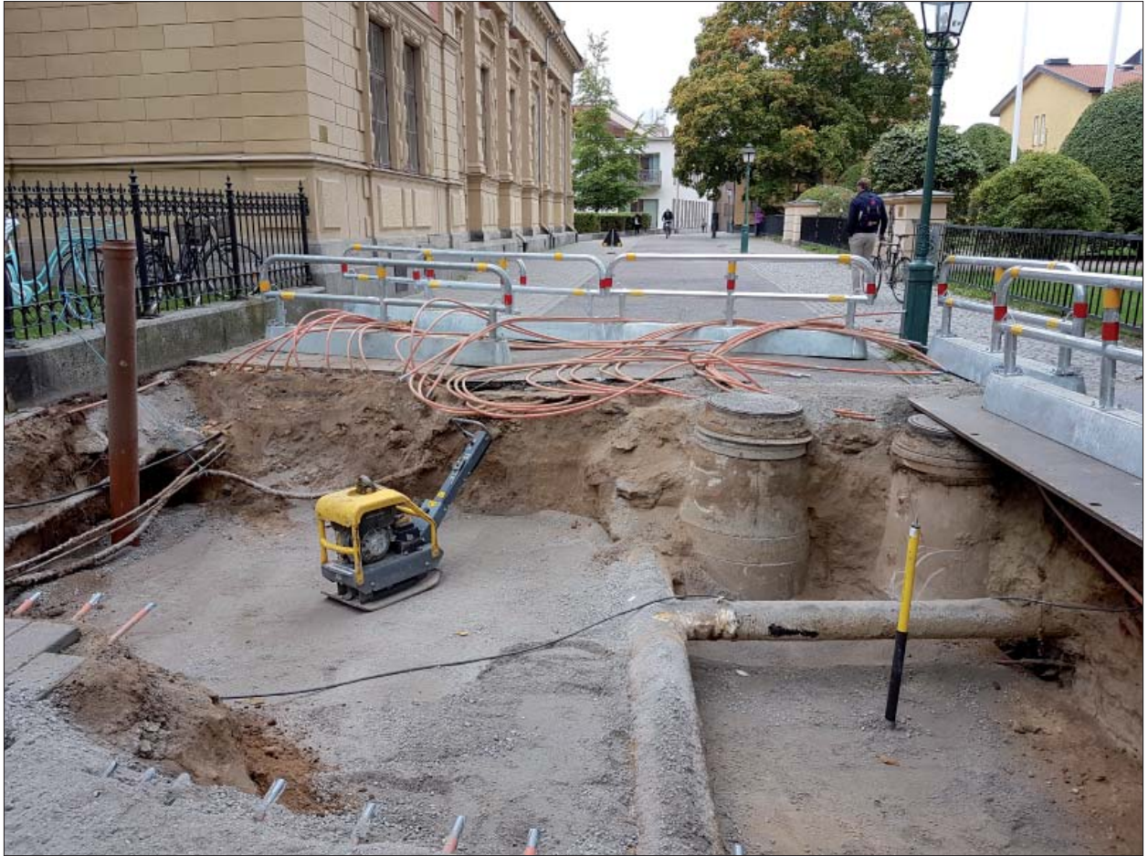
Figur 3. Det öppnade schaktet mot väster.