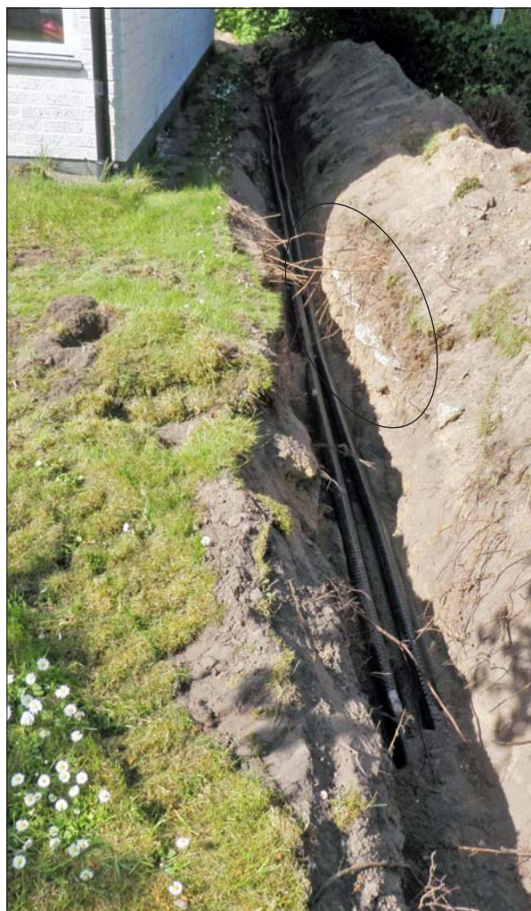
Figur 3. Schaktsträckan öster om bostadshuset. I mitten av schaktet, i högra schaktkanten, syns en rad kalkstensplattor från en äldre trädgårdsgång som senare överlagrats av påförd trädgårdsjord.

Anslutningen innebar att 30 m schakt inne i kvarteret och 10 m tvärs över Järnvägsgatan grävdes. Inne på tomten framkom, under den påförda trädgårdsjorden, en gång lagd med kalkstensplattor. Denna har förmodligen tillhört det hus som stått på platsen före den nuvarande moderna villan. I övrigt berördes endast naturliga sandlager och inget av arkeologiskt intresse påträffades vare sig i gatan eller inne på tomten.