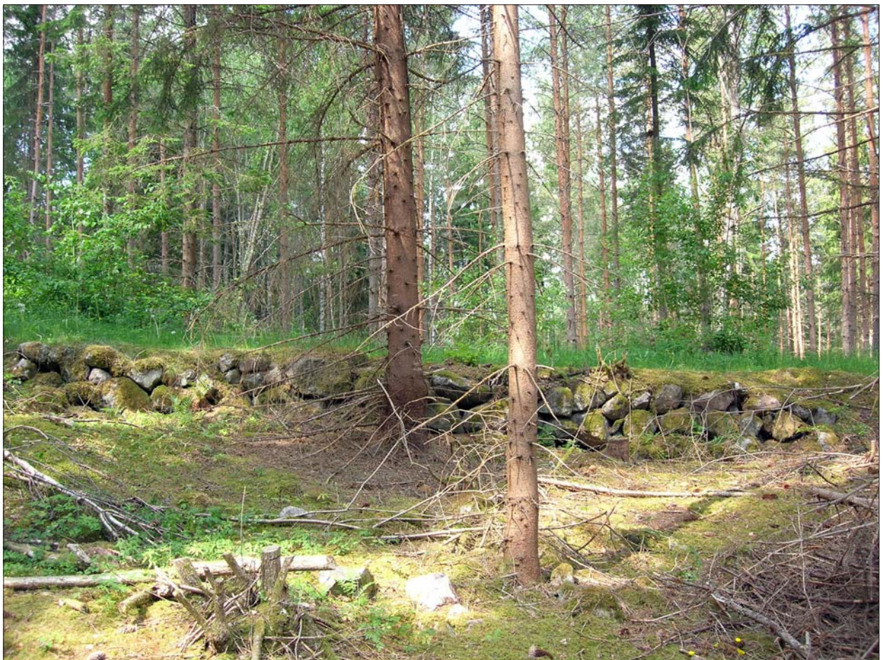
Figur 6. Vägbanken, här sedd från ÖSÖ, är ställvis väl uppbyggd med synlig kantskoning av sten, framförallt över sankare partier.

Rikets allmänna kartarkiv, RAK, rakid J112-45-10, häradsekonomska kartan 1868-77, bladnamn Björsäter.