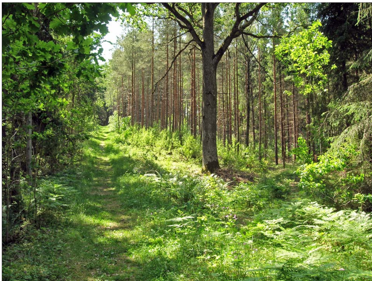
Figur 5. Foto, från NNÖ, som visar två sammanlöpan- de vägbankar som representerar olika tidsfaser av vägens sträckning. I bildens vänstra del löper den senare uträtade och väl kantskodda vägbanken. Till höger i bilden kan den ursprungliga vägsträckningen i form av en lägre och något smalare vägbank skönjas.

Nilsson, P. 2004. Arkeologisk utredning, etapp 1. Blidsäter 1:2, Björsäter sn, Åtvidabergs kommun, Östergötlands län. Riksantikvarieämbetet UV Öst, dnr 421-4069-2004. Anmälan av utförd arkeologisk undersökning. Arkivmaterial, Östergötlands museum.