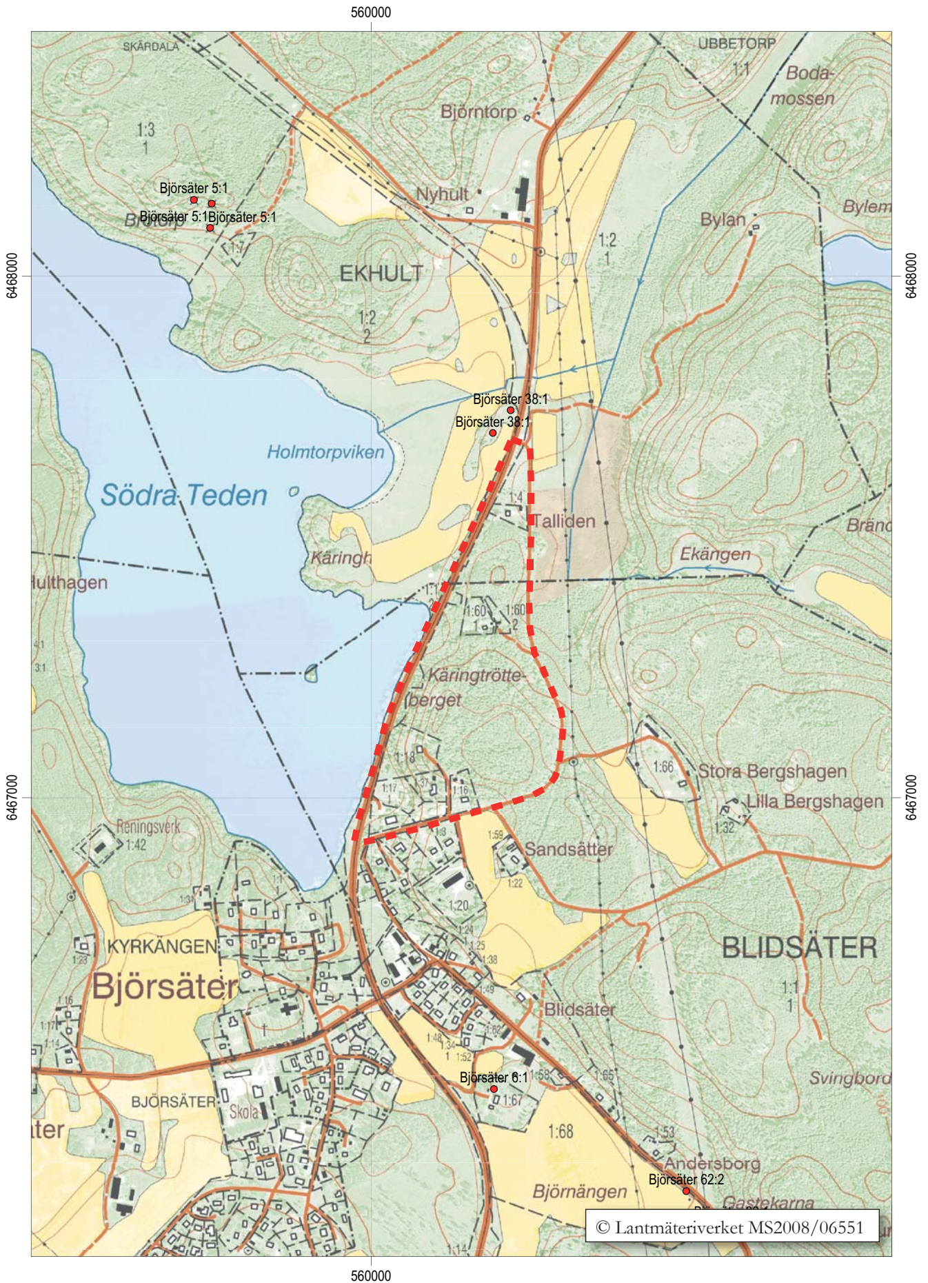
Figur 2. Utdrag ur digitala Fastighetskartan, blad 64F 6f NO och 64F 6g NV, med utredningsområdet markerat. Skala 1:10 000.