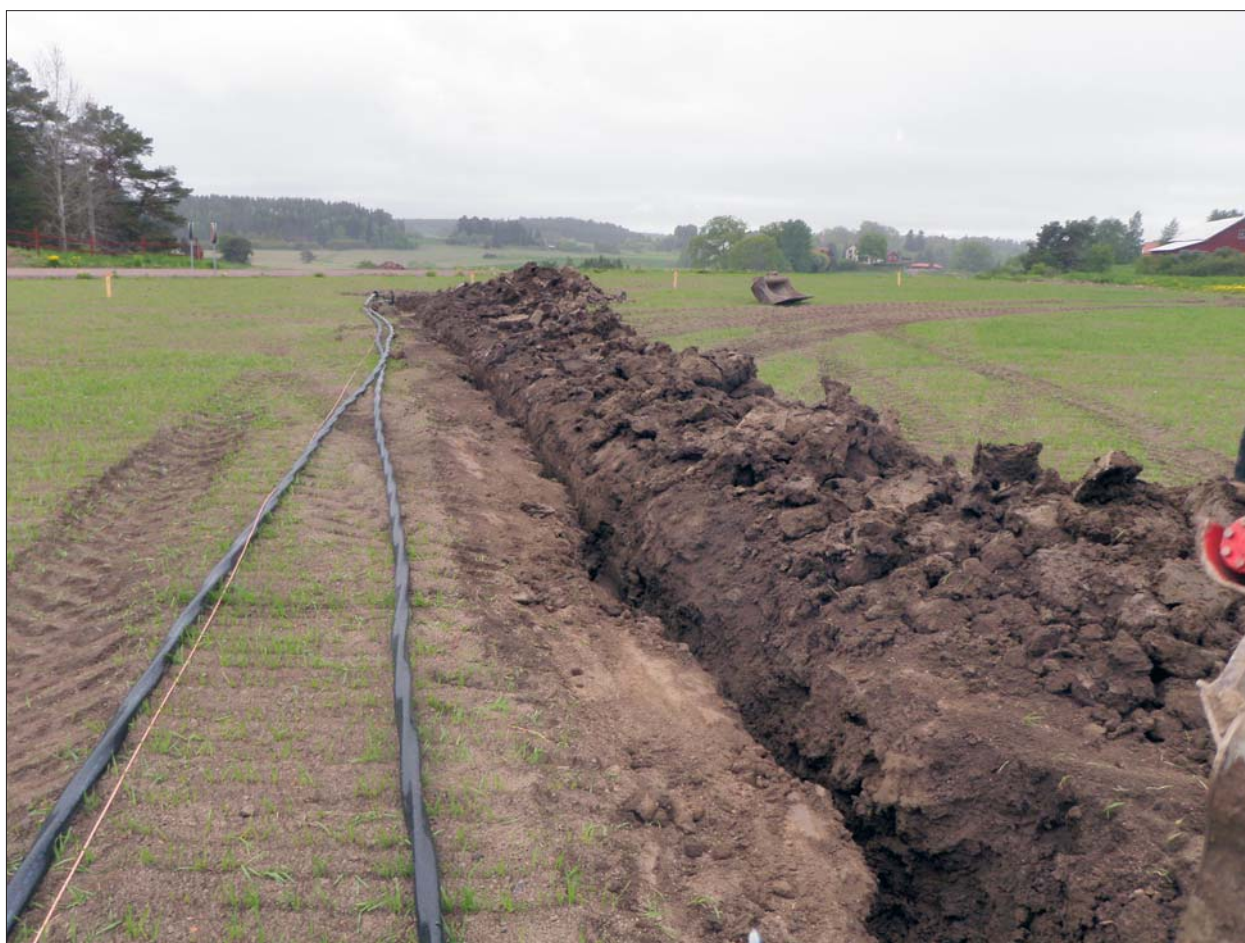
Figur 5. Pågående schaktning vid RAÄ 307. Schaktet sett mot söder med de registrerade boplatsen till vänster i bild. Endast jordbruksmark berördes.

Vid grävning av schaktet väster om RAÄ 307 framkom ingenting av arkeologiskt intresse i själva schaktet. Däremot observerades (liksom tidigare) att skärvig och skörbränd sten förekom i relativt stora mängder längre österut, på den som boplats registrerade ytan. Schaktet väster om Lilla Kolstads bytomt kom endast att beröra gammal åkermark och inget av arkeologiskt intresse framkom.