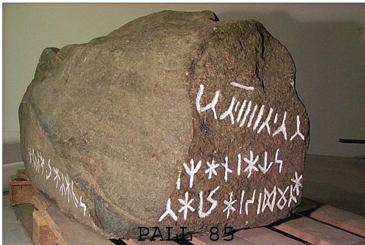
Figur 4. Runstenen från Patergårdet i Ällestad förvaras liggande med texten upp och nedvänd i SHM:s magasin. Bilden visar stenens ovansida närmast i bild. De flesta bevarade runorna finns på stenens ovansida eller topp. På den sida av stenen som är närmast kameran har ett stort stycke fläkts loss ur sidan av stenen varför endast en rad runor är bevarad. Även toppsidans inskription är skadad. De förmodade besvärjelserunorna syns överst på toppsidan.

Stenen hittades på gården Patergårdet 1936 i kanten av ett dike. Enligt Arthur Nordén (Nordén 1936) påträffades stenen redan 1934 när bonden försökte räta ut ett dike, men trots att runor upptäcktes, uppmärksammades detta inte förrän 1936. Runinskriften är fördelad på två av blockets sidor. På ena smalsidan finns en ensam rad runor som tillsammans med toppytans inskrift lyder: "Jag Sigmar ... av ... reste stenen ...". På toppytan finns dessutom ett antal tecken vilka inte har kunnat tydas och som av Nordén anser vara besvärjelserunor, rytmiskt