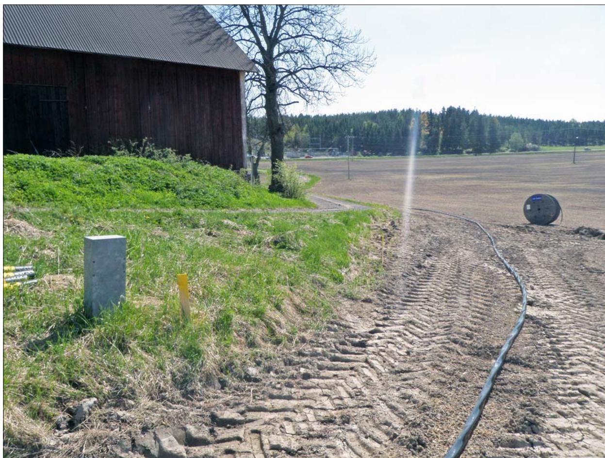
Figur 6. Elledningen utlagd vid Lilla Kolstad. Sträckningen sedd mot söder.

Nordén A. 1937. Söderköpingsstenen. En nyfunnen runsten med magiskt syfte från "övergångstiden" . Fornvännen 1937.