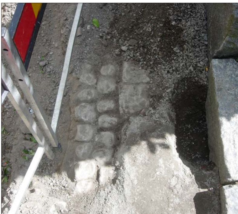
Figur 4 ovan t v. Schaktet i kv Pilgrimen 7 mot SV.