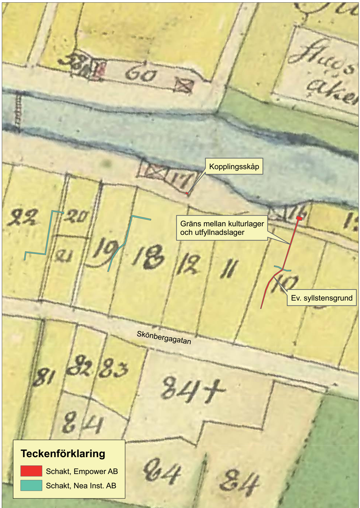
Figur 7. Schakten markerade på 1779 års karta över Söderköping (LMS akt D111-1:16). Skala 1:750.