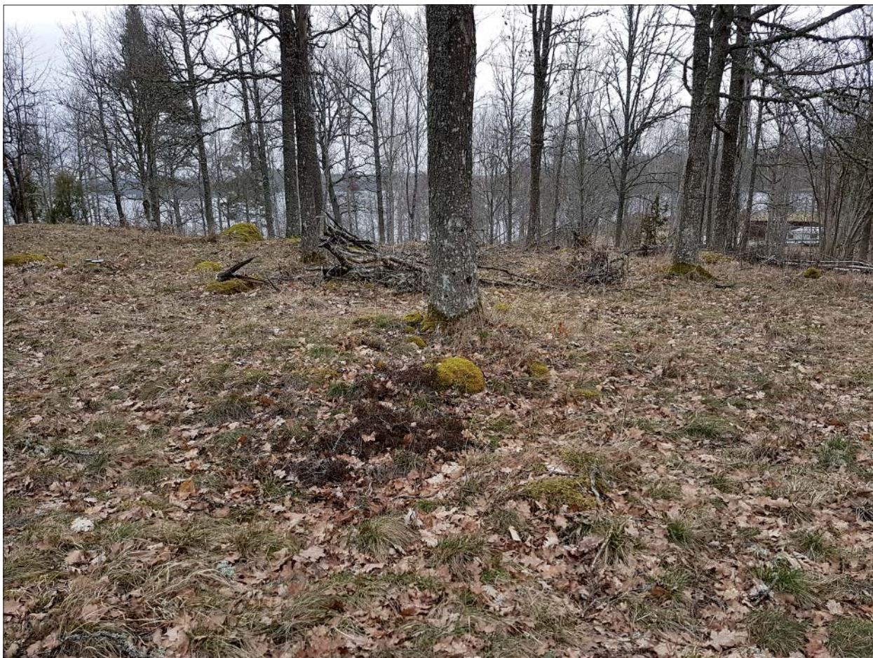
Figur 3. Ett flackt och kraftigt övertorvat röjningsröse på Aggarpa kulle, sett från sydväst. Inom den fossila åkerytan återfinns ett 20-tal liknande röjningsrösen. Området utgör idag ett litet rekreativsområde söder om sjön Östra Lägern.

Under fältarbetet genomfördes terrängrekognosering av hela det aktuella planområdet. Vid besiktningen kunde konstateras att den redovisade utsträckningen av röjningsröseområdet RAÄ-nr. Västra Ryd 164:1 var felaktig. I samband med arbetet genomfördes därför en kvalitetshöjning av uppgifterna i Fornreg kopplade till den berörda lokalen. Kvalitetshöjningen innefattade inmätning av lämningen med GPS och upprättande av beskrivning av lämningen i enlighet med Riksantikvarieämbetets nomenklatur för dokumentation av forn- och kulturlämningar, då detta saknades sedan tidigare. Röjningsröseområdet uppfyller också gällande krav för fornlämning, varför den antikvariska bedömningen i Fornreg kom att ändras.