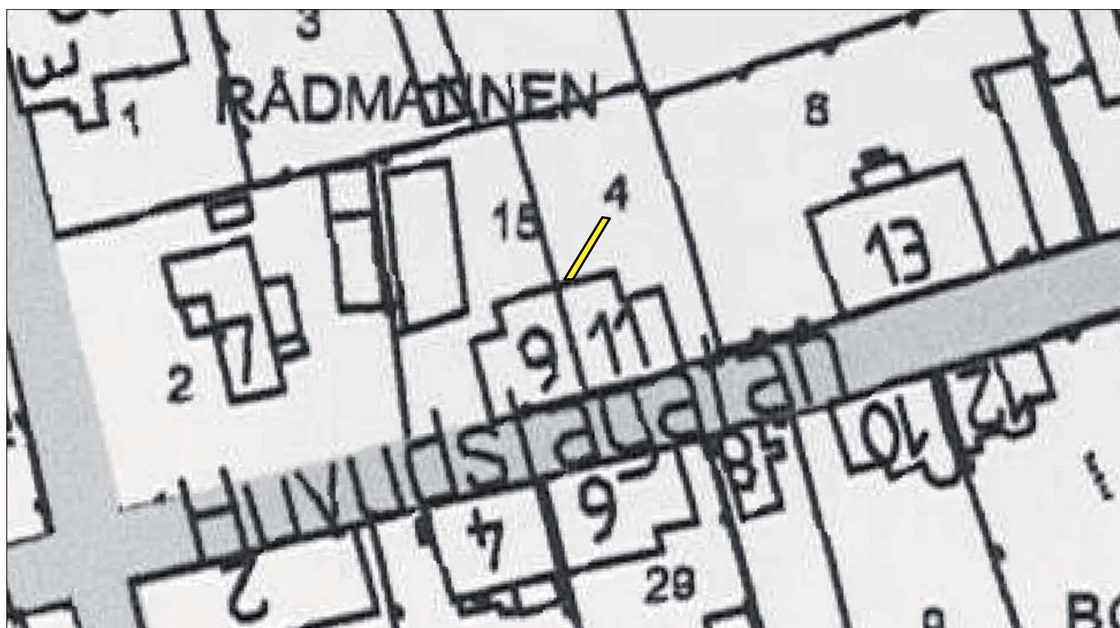
Figur 3. Det undersökta schaktet mot bakgrund av en adresskarta över Vadstena stad. Skala 1:600.

Vadstena stad som är den yngsta av Östergötlands sex medeltida städer fick sina stadsprivilegier år 1400. Stadsbildningen var ett resultat av birgittinerklostrets etablering år 1368 och den stadsbebyggelse som började växa fram i samband med denna. Idag är ett 20-tal stenhus från den medeltida bebyggelsen bevarade; bl a rådhus, biskopens bostadshus, kungsgård, kloster och klosterkyrka. Kvarteret Rådmanen ligger inom fornlämningen RAÄ 21:1 – Vadstena medeltida stadsområde – och är beläget inom en del av staden som anses ha blivit bebyggd under 1400-talets andra hälft, drygt 100 m söder om platsen för den äldsta kyrkan. Vad gäller äldre lämningar inom det medeltida stadsområdet har det konstaterats att dessa generellt inte uppträder på en djupare nivå än ca 0,2 - 0,3 m under befintlig markyta. Åtminstone inom tomtmark med äldre bebyggelse. Vidare så överstiger kulturlagertjockleken sällan 1 m och uppvisar en diffust stratifierad lagerbild som kan vara "kronologiskt kompakt", d v s att fynd från t ex 1400-talet kan återfinnas på samma nivå som fynd från 1600-talet. Fenomenet är relativt välkänt från andra skandinaviska städer som anlagts under senmedeltid och anses allmänt bero på låg kulturlagertillväxt till följd av ett förändrat förhållningssätt till avfallshantering (Lundberg 2008).