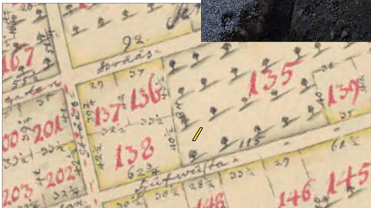
Figur 4. Schaktet mot bakgrund av 1705 års stadskarta. Skala 1:1000.