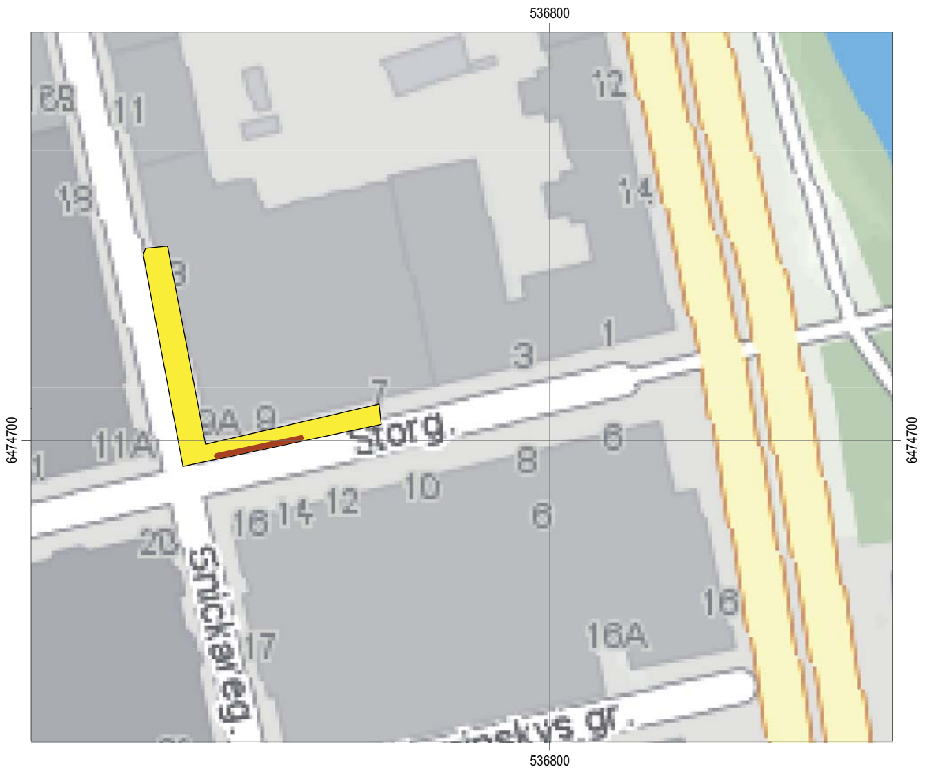
Figur 3. Undersökningsytan mot bakgrund av adresskarta över Linköpings innerstad. Det bevarade kulturlagret är markerat. Skala 1:1000.