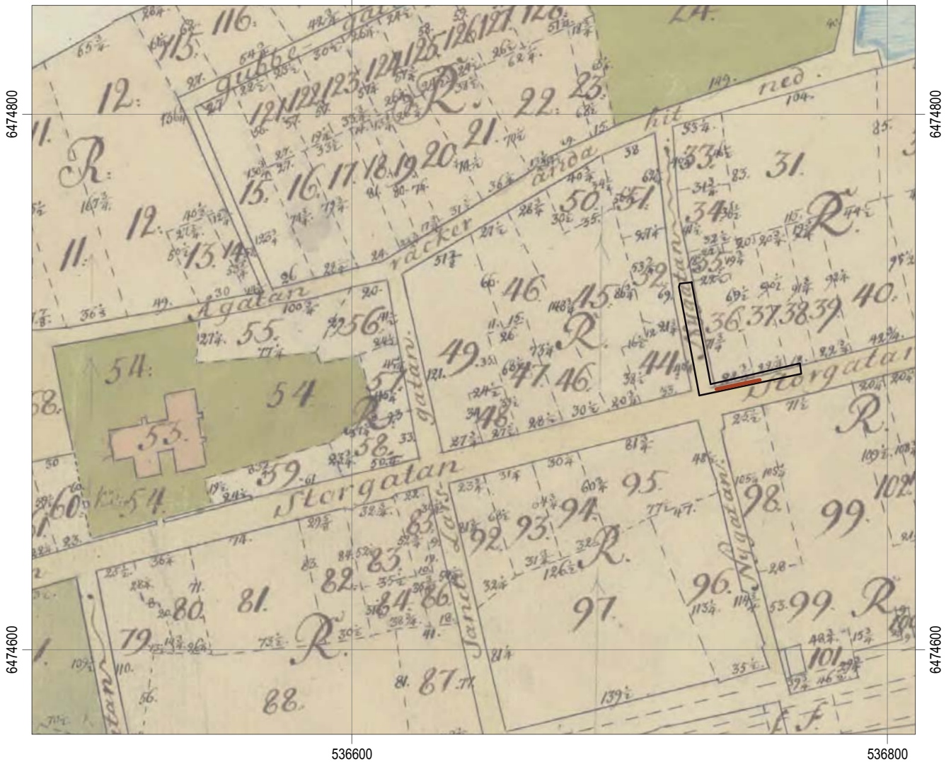
Figur 5. Undersökningsytan mot bakgrund av 1757 års karta över Linköpings innerstad. Skala 1:2000.

Hörfors, O. 1992. Kv Borgmästaren 11, Repslagaregatan/Ågatan . Arkeologisk förundersökning. Östergötlands länsmuseum.