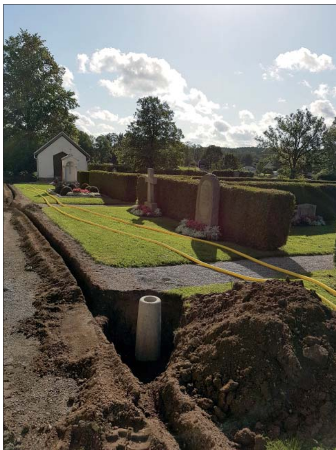
Figur 4. I förgrunden syns ett av fundamenten och i bakgrunden det smala och grunda schaktet för elkabeln som drogs mellan fundamenten.

År 1998 grävdes några schakt precis intill kyrkan, norr om kyrkotornet, med anledning av nedläggning av ledningar för bergvärme. Där var det mycket omrört och inget av arkeologiskt intresse hittades (Ohlsén 2000).