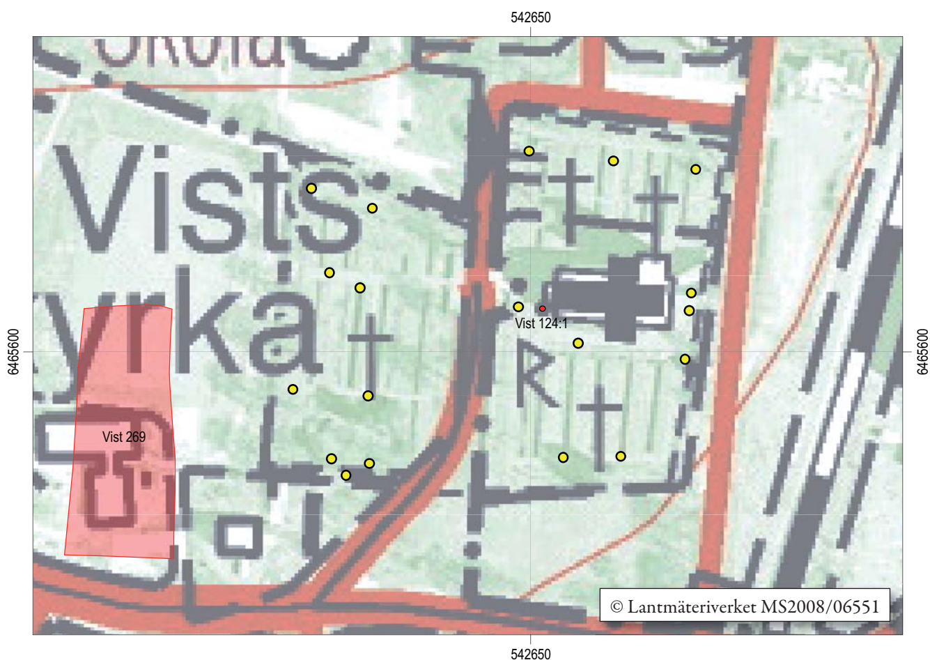
Figur 3. Gula punkter markerar de schakt som grävdes och undersöktes för belysningsfundamenten. I närheten syns även fornlämningarna L2008:6655 (RAÄ Vist 269), gårdstomt, och L2010:7844 (RAÄ Vist 124:1), runsten som står till höger om kyrkans entré. Skala 1:1 500.

Kyrkogården är indelad i en gammal och en ny del. Kyrkan ligger på den gamla kyrkogården, och den nya kyrkogården ligger väster om den gamla. Den gamla kyrkogården utökades norr om kyrkan år 1870, vilket gav kyrkan den centrala placeringen på kyrkogården som syns idag. Den nyare, västliga delen av kyrkogården anlades under 1930-talet (Kreutz 2006:4f).