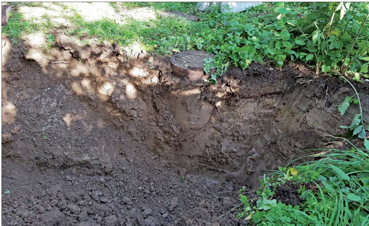
Figur 3. Schaktet under grävning. Foto mot NV, Anders Olofsson, ÖM.

Det aktuella arbetsföretaget utgjordes av framtagning av befintliga VA-ledningar intill befintliga brunnar. Vid undersökningen visade det sig att den av schaktningsövervakningen berörda gropan, 4,4 x 2,5 m (NÖ-SV) och 1,7 m djup, kom att grävas helt och hållet i ett gammalt schakt. Jordmassorna var därför omrörda, och eventuella fornlämningar redan bortgrävda. Inget av arkeologiskt intresse framkom vid undersökningen.