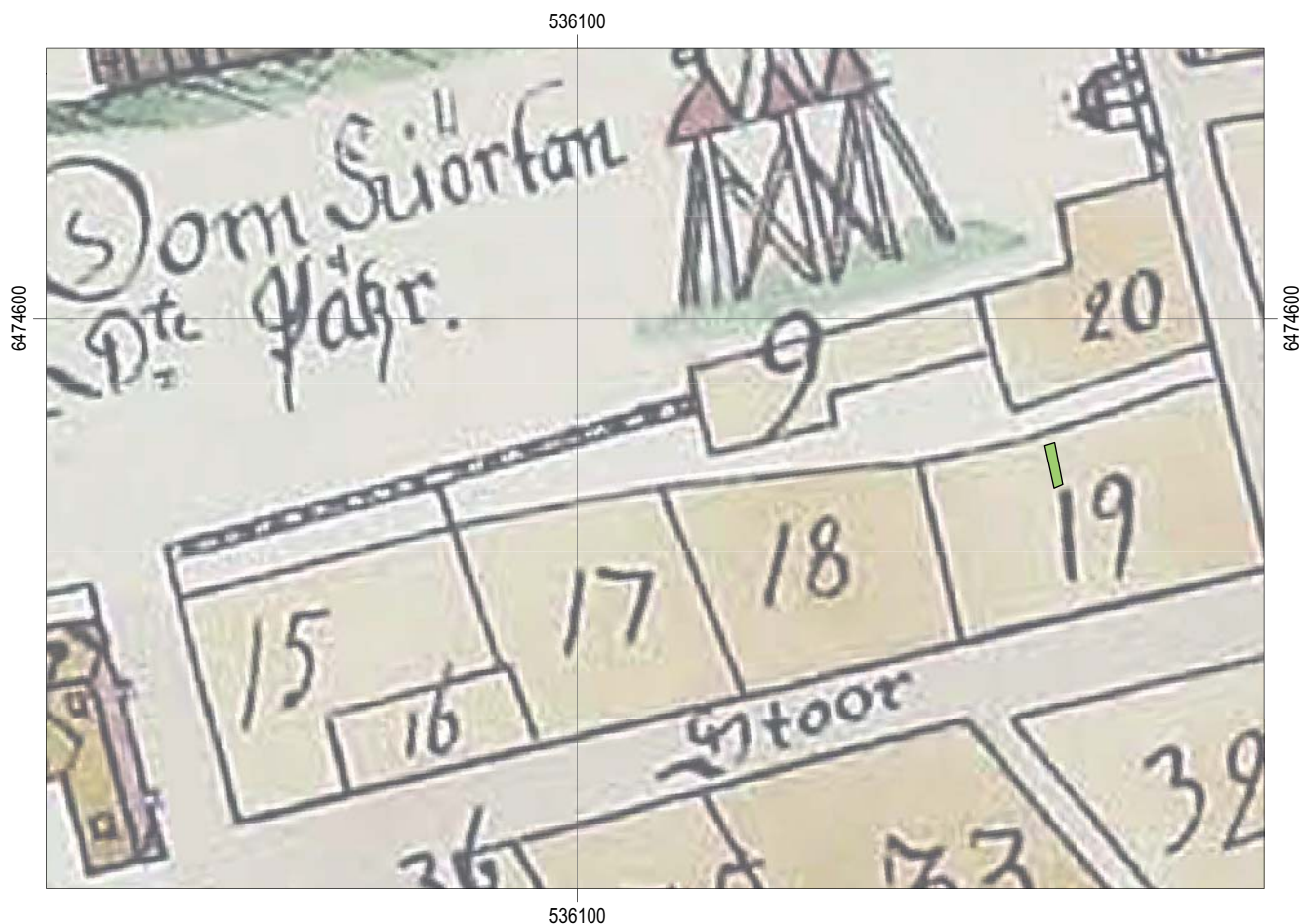
Figur 3. Schaktet mot bakgrund av 1696 års karta. Skala 1:1000.

Nordväst om tomten, i kv Abboten 3, inryms domkyrkans församlingshem i den medeltida Domskolan vars äldsta kvarstående del är från 1300-talet (Tagesson 2002:319).