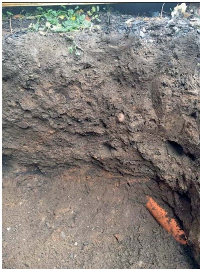
Figur 6. Endast omrörda massor ovan den orörda undergrunden. Foto från söder, Helén Romedahl, ÖM.