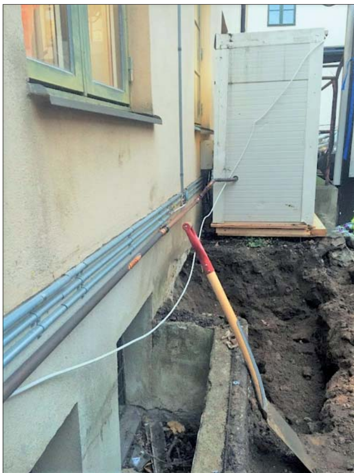
Figur 5. Schaktet i kv Abboten. Foto från söder.