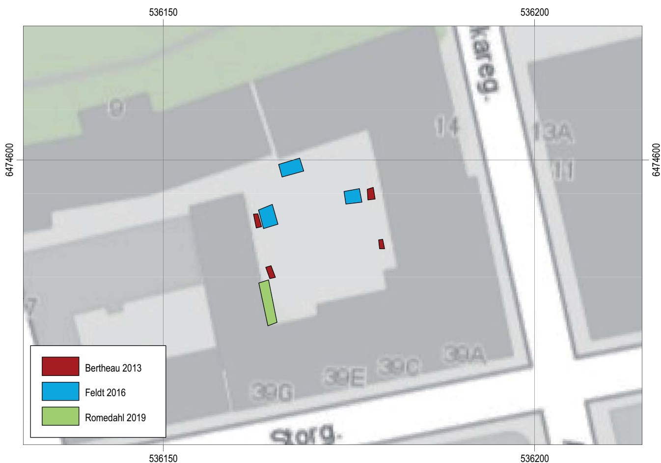
Figur 4. Några av de tidigare arkeologiska undersökningar som gjorts i kv Abboten 4. Skala 1:500.

Syftet med den arkeologiska undersökningen var att se till att fornlämningen berördes i så liten omfattning som möjligt av det planerade arbetsföretaget och de fornlämningar som framkom skulle dokumenteras avseende karaktär och omfattning samt om möjligt dateras. Undertecknad handgrävde en yta om ca 1,4 x 1,2 m ned till ett djup om ca 0,6 m. Digitala foton togs och en planritning upprättades. Dokumentationsmaterialet förvaras på Östergötlands museum.