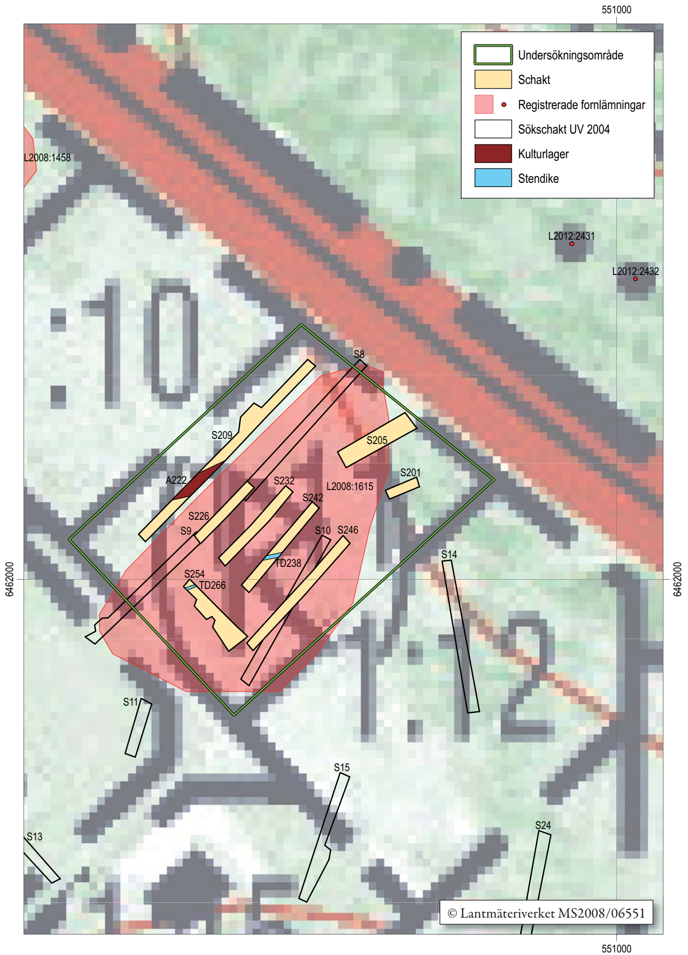
Figur 4. Utdrag ur digitala Fastighetskartan med undersökningsområdet, sökschakt och fornlämningar markerade. Skala 1:500.