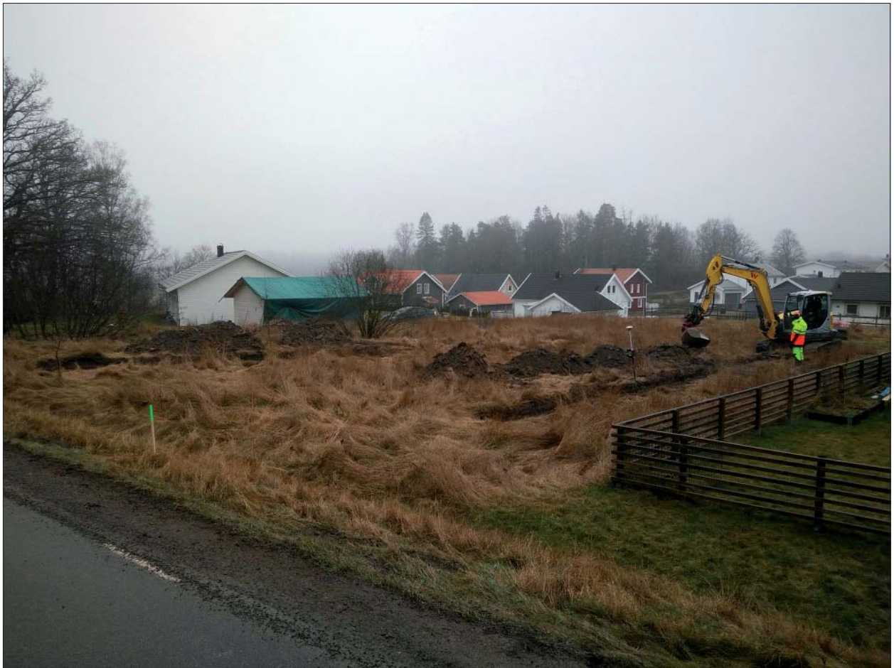
Figur 5. Undersökningsområdet sett från norr.