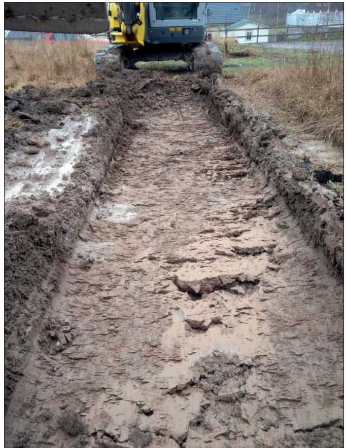
Figur 6. Schakt 209 med anläggning A222.

Kulturlager? Av brunare sandigare/siltigare material med inslag av grus och småsten. Inslag av bränd lera och kol. Fåtaligt med tegelkross. Enstaka bränt ben och porslin/flintgods. Förefaller ganska modernt. Gårdsplan/aktivitetsyta/hantverk?