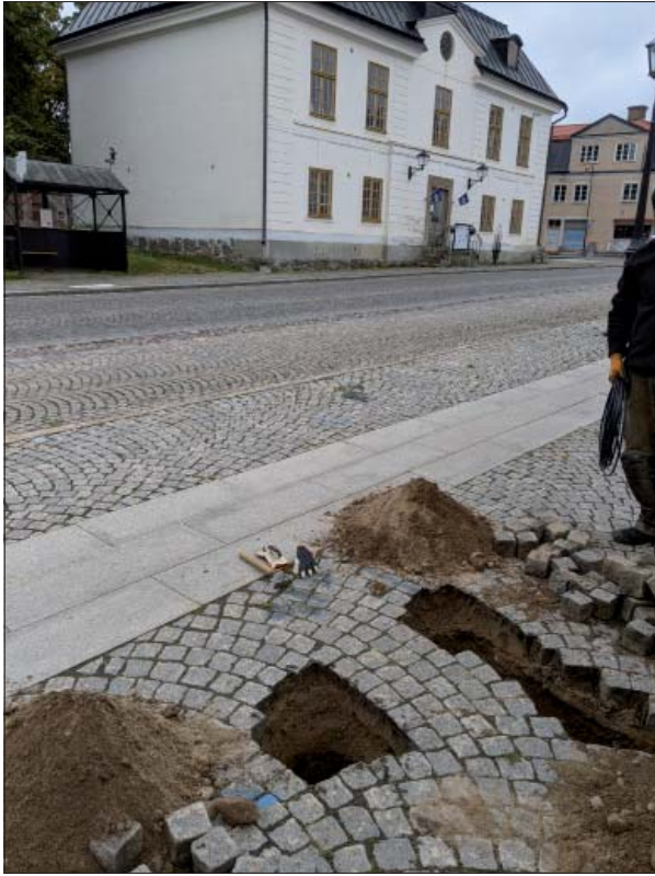
Figur 3. Hål för fundament vid Stora Torgets södra sida. Foto mot väster, Mats Magnusson, ÖM.