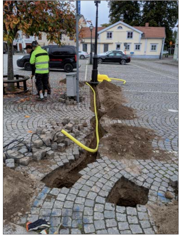
Figur 4. Schakt för belysning vid Stora Torgets östra sida. Foto mot norr, Mats Magnusson, ÖM.