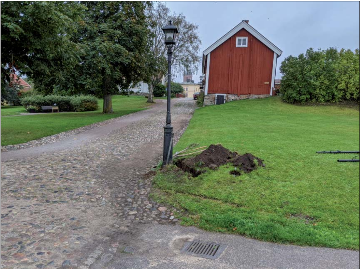
Figur 6. Schakt för elkabel, Järntorgsparken. Foto mot söder, Mats Magnusson, ÖM.