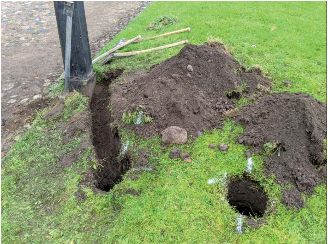
Figur 7. Såsom framgår av bilden rörde det sig i allmänhet om mycket små och grunda schakt. Foto mot söder, Mats Magnusson, ÖM.