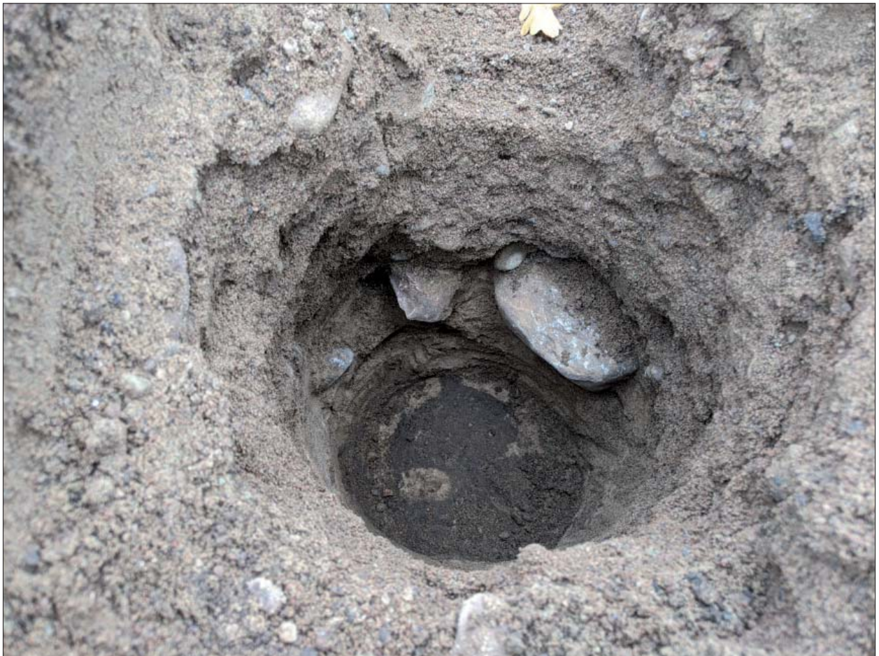
Figur 5. Fragment av stenläggning, Stora Torget. Översiktsbild, Mats Magnusson, ÖM.