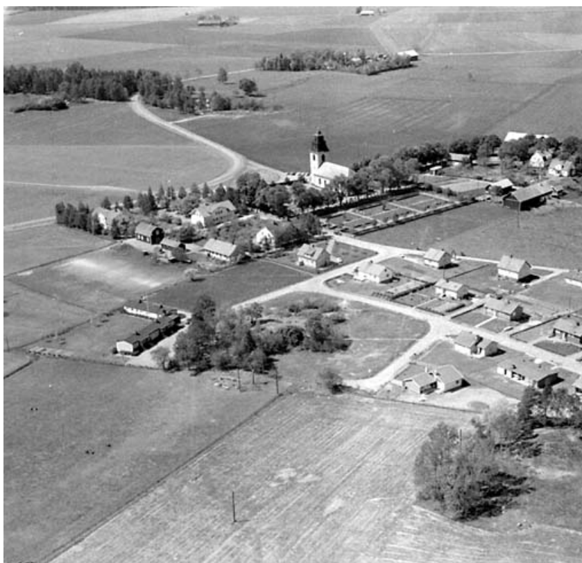
Flygfoto över Rystad från sydöst, 1965. Mitt i bilden syns den nya kyrkogården som anlades på 1950-talet.

År 1783 var byggnadsarbetena på den nuvarande kyrkan i Rystad färdigställda men kyrkan invigdes först 1796. Den ersatte då den medeltida kyrkan och byggdes som gemensam kyrka för Rystad och Näsby socknar. Kyrkan och omgivande kyrkogård ligger ca 8 km nordost om Linköping på en svag höjd med utblickar över det fornlämningsrika odlingslandskapet. Till kyrkomiljön hör f d skola, ålderdomshem, lärarbostad och kommunalhus. (Östergötlands länsmuseum 2006)