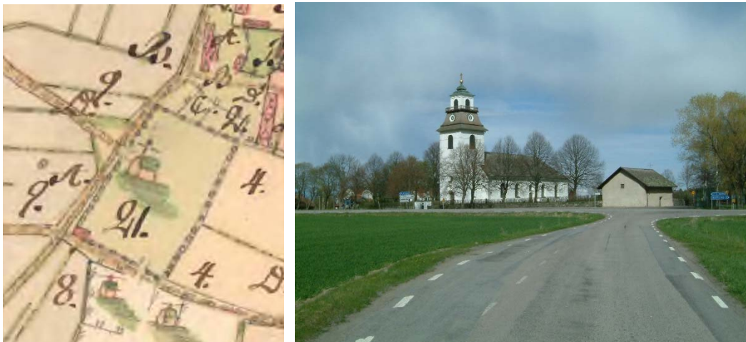
T v: Laga skifteskarta för Bosgårds by 1807. Lantmäteriet, akt nr D 86-5:1. T h: Rystad kyrka och gravkapell/bod från sydväst.

Till miljön hör även gravkapellet byggt som kyrkbod och sockenmagasin senast under början av 1700-talet.