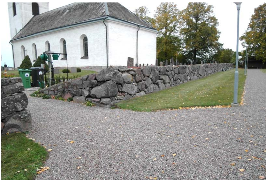
Östra muren med öppning mellan gamla och nya kyrkogården. Före justering..

Östra muren vid gamla kyrkogården har enbart förstärkts med skolning, utom när det gäller öppningen mellan gamla och nya kyrkogården. Där plockades muren norr om öppningen delvis om.