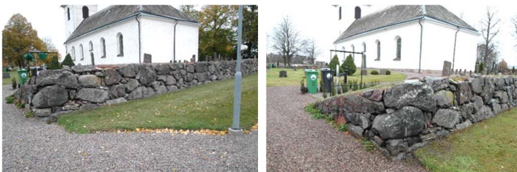
T v: Öppningen mellan gamla och nya kyrkogården. Här gjordes en justering av norra hörnet. T h: Efter justering.