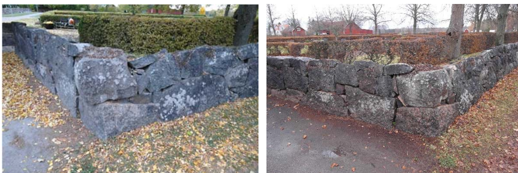
Sydvästra murhörnet vid nya kyrkogården före och efter omläggning.

I arbetshandlingarna bedömdes inte den södra muren behöva några direkta åtgärder. Enda åtgärden är lagning av sydvästra hörnet vid nya kyrkogården.