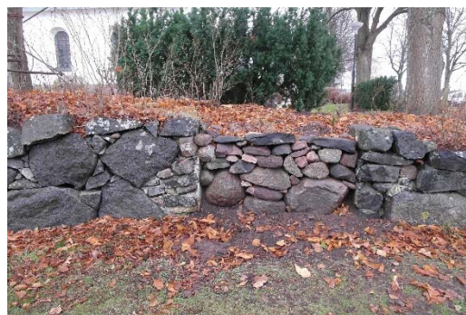
Igensatt öppning i norra muren, före och efter omläggning.