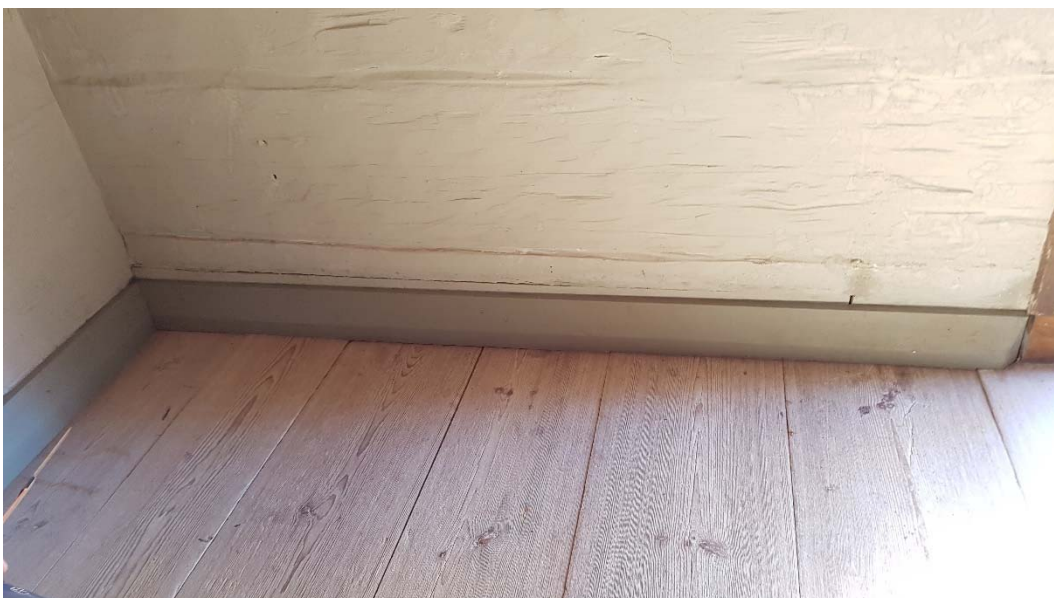
Den ilagade delen av syllstocken, skarven närmast över golvsockeln, har målats in i väggfärg.