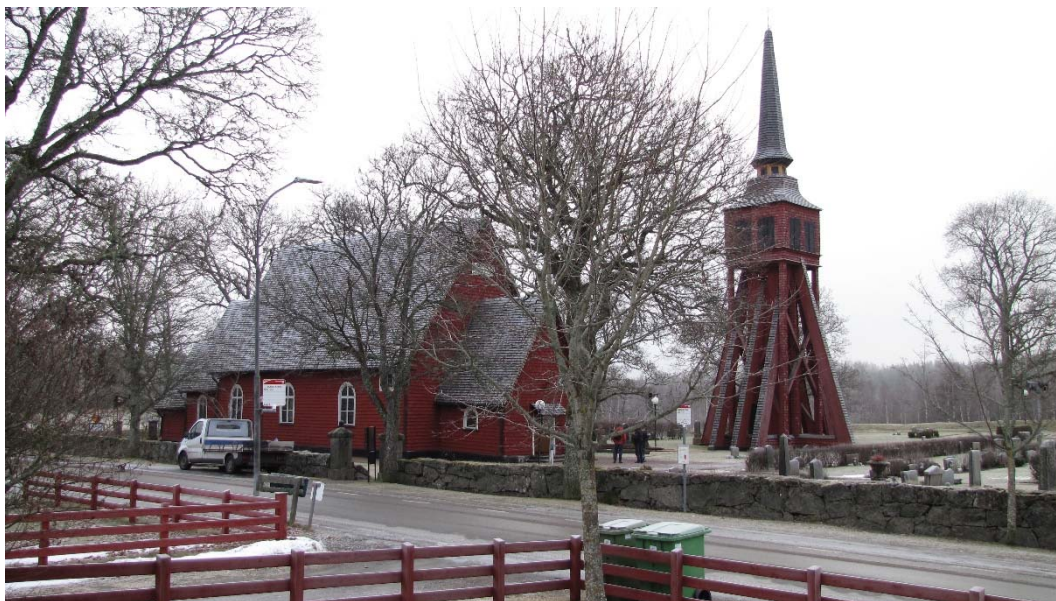
Ulrika kyrka och klockstapel från nordväst.

Ulrika socken bildades 1736 och en kyrka uppfördes året därpå. Kyrkan byggdes i liggtimmer med långhus och ett mindre kor med högt brant spåntäckt tak och spånklädda fasader. Sakristians placering öster om koret var relativt ovanlig vid den här tiden.