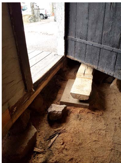
Kvarvarande frisk del av golvbjälken.