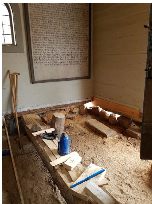
Ilagning med friskt virke.

Man fick ta bort lite mer timmer än beräknat, men det rör sig ändå om en begränsad skada. Det beslutades att sätta tillbaka den gamla golvsockeln även fast det innebär att den inte täcker allt iskarvat lagningstimmer. Där nytt timmer syns, målades det in i väggfärg. En mindre del av golvbrädorna behövde bytas ut och de nya brädorna lades i vapenhusets sydöstra hörn, där de döljs bättre än i sydvästra hörnet. Det första provet på ”nytt” golvvirke bedömdes vara för avvikande och istället gjordes lagningen med golvbrädor från en gård mellan Kisa och Rimforsa.