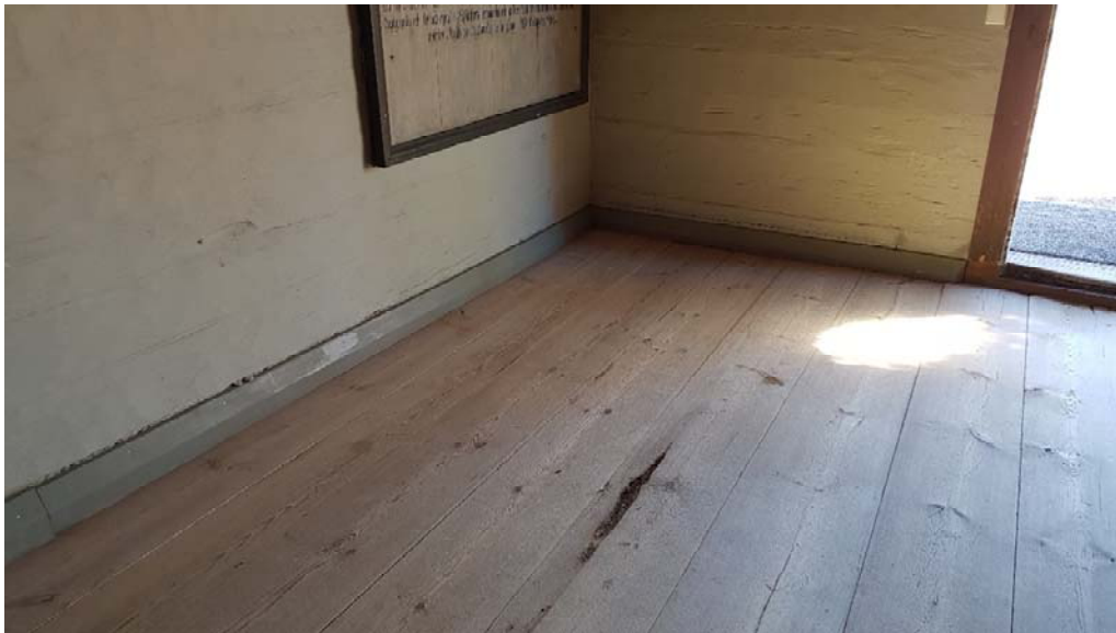
Sydvästra hörnet efter lagning. Golvbrädorna har återlagts så att den ilagade delen hamnar bakom dörren in till vindfånget.