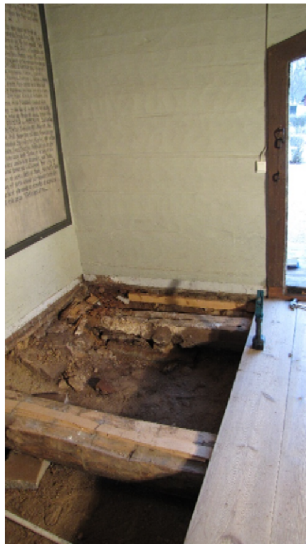
T v: Svampsporer på vapenhusets golv.