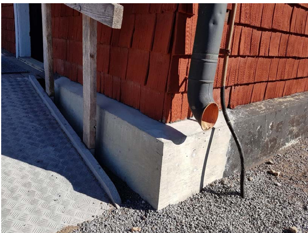
Nyjutet del av sockeln.