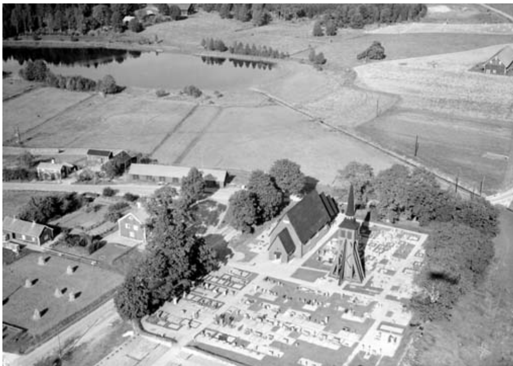
Kyrkomiljön i Ulrika 1954.

Kyrkan är skyddad enligt 4 kap Kulturmiljölagen.