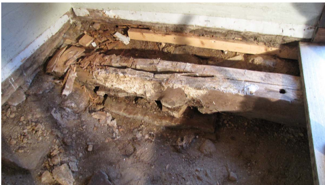
Vapenhusets sydvästra hörn. Även delar av syllan i väster är skadad.