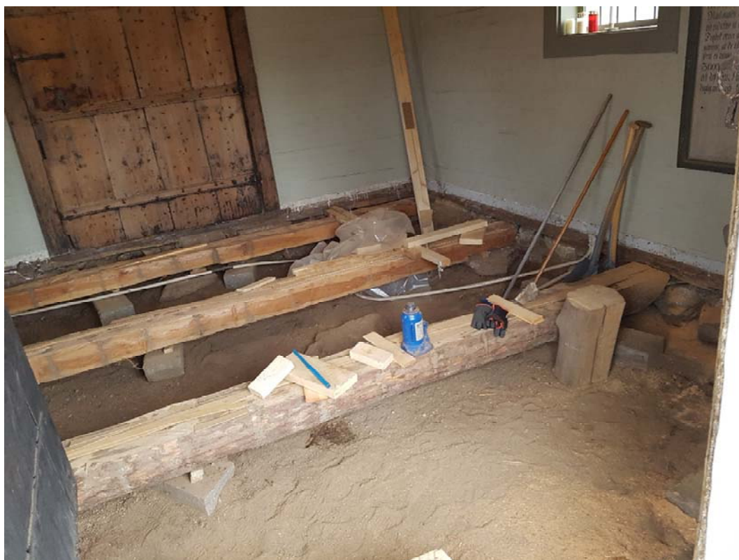
Befintligt golvbjälklag med bl a kilning av upplaget. Den västra bjälken var bortplockad vid fototillfället.

Av ett byggmötesprotokoll från 1997 framgår det att en stockbjälke behöver bytas och att samtligas upplag åtgärdas för stabilitet, innan golvbrädorna återläggs. En del fyllnadsmaterial bortschaktas för att ge plats för luftning. Upplag vid entrédörr placeras närmare denna för att göra golvet stabilare vid insteget.