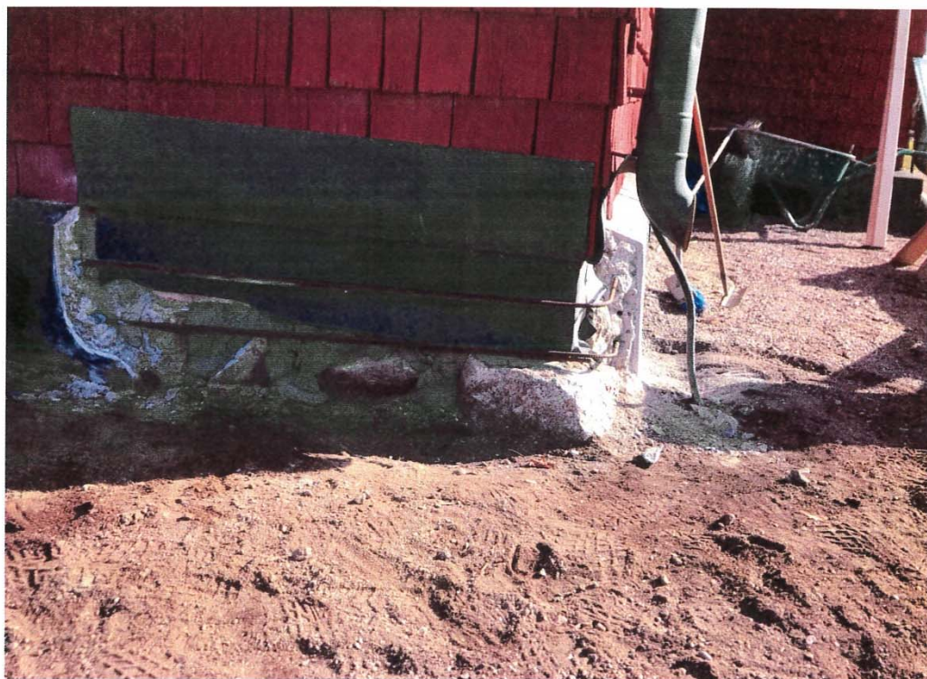
Bilaga. Foton tagna under arbetets gång av Marcus Samuelsson.