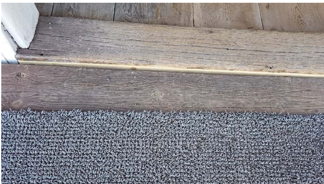
Del av "träskelsyllen" har bytts ut.

Betongsockeln i sydvästra hörnet var sprucken och det kan ha bidragit till att det kommit in fukt i vapenhusgolvet. Sockeln finns runt hela kyrkan och består av relativt grov betong. Lagning gjordes med färdigblandad grovbetong från Finja och hörnet armerades med två stycken 12 mm armeringsjärn. Mellan betongen och timmerstommen lades papp. Betongens ytstruktur motsvarar sockeln i övrigt. Utvändigt, närmast sockeln, lades en platonmatta och sedan dränerande grus. Grävningen gjordes ca 2 m ut och 0,5 – 0,6 m djupt.