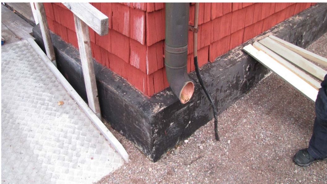
En spricka går diagonalt i sockeln, ungefär från åskledaren och ner mot väster.