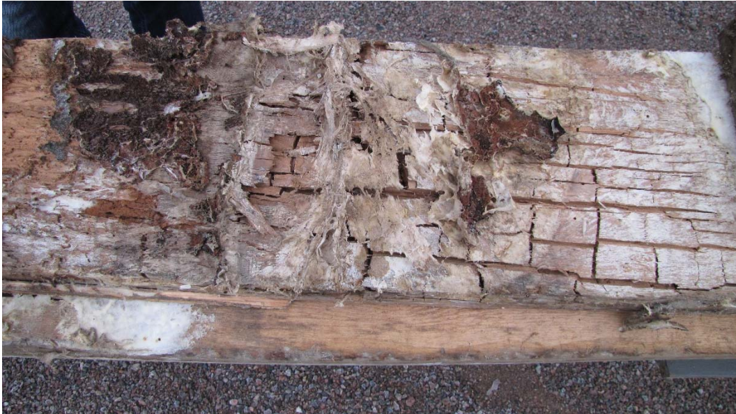
En borttagen bräda som visar angrepp av äkta hussvamp.