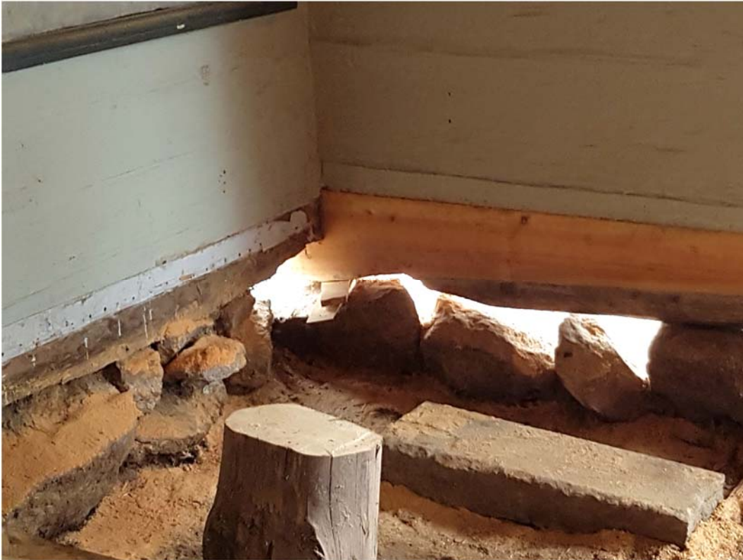
Ilagning i västra väggen.