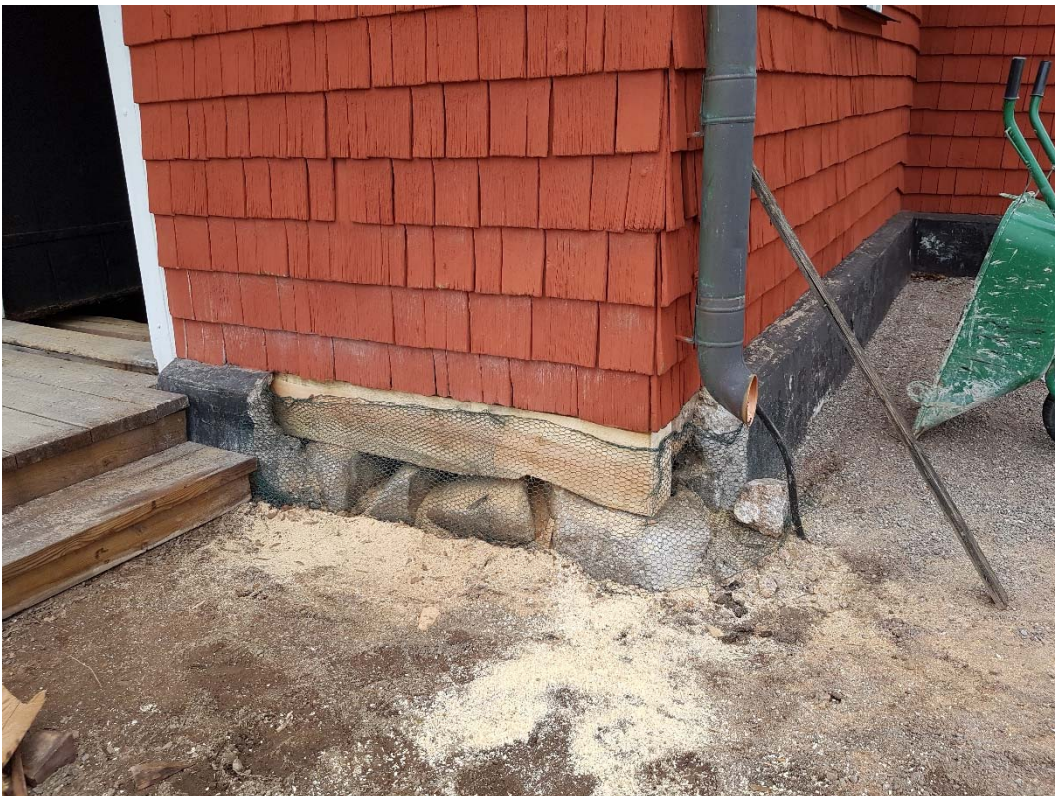
Ilagningen sedd från utsidan. Nätet har satts upp för att hindra djur från att komma in.