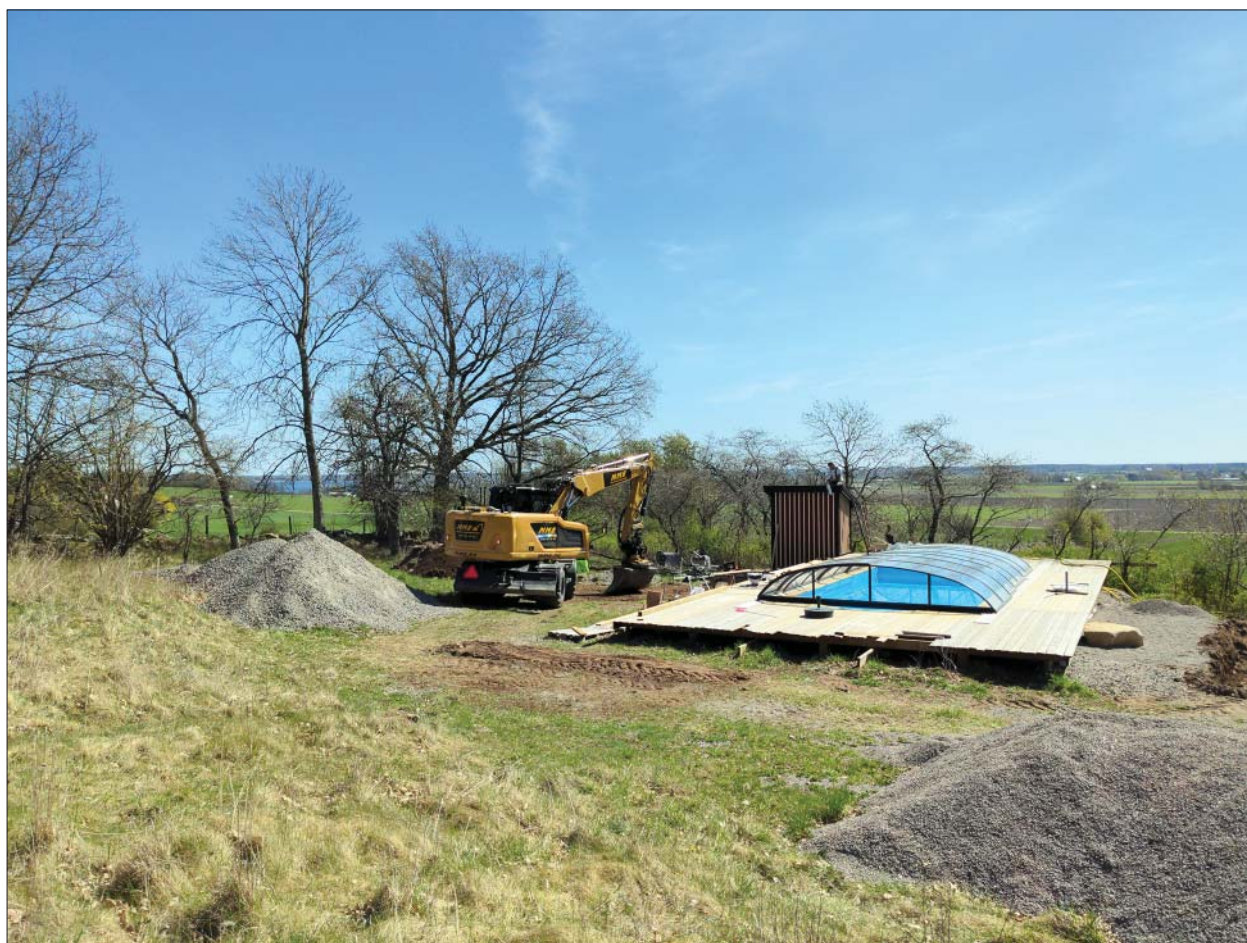
Figur 4. Östra delen av undersökningsområdet. Foto mot sydöst