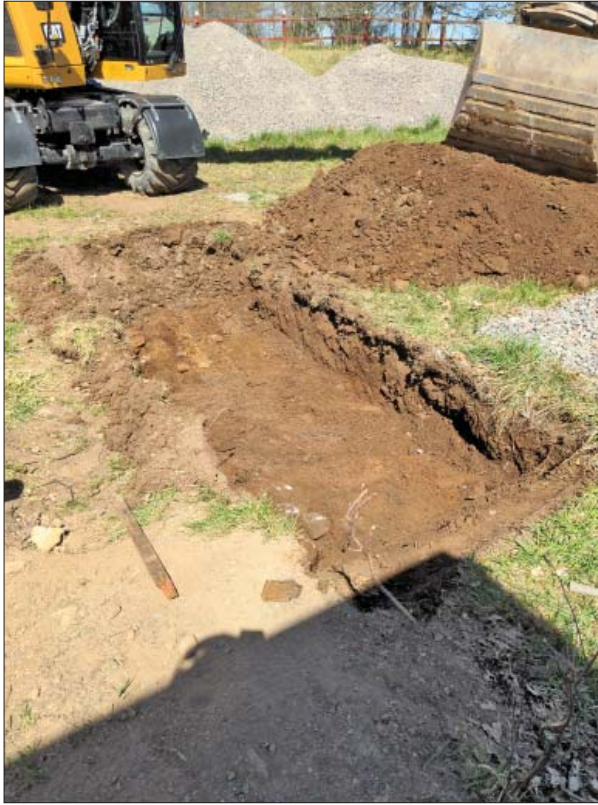
Figur 9. Schakt 232. Foto mot nordöst.

andra lämningar eller spår i området. Det bör dock i sammanhanget påminnas om att den ursprungliga/naturliga markytan kan ha blivit ganska åtgången i samband med att terrasseringen skapades och/eller i samband med aktiviteter kring detta. Terrasseringens tidsmässiga ursprung har inte gått att spåra närmare. Flygfoton från 1960 visar på ett utseende snarlikt dagens. Området finns även markerat på häradsekonomiska kartan från 1868 - 77 men någon vidare slutsats därifrån kan svårligen dras.