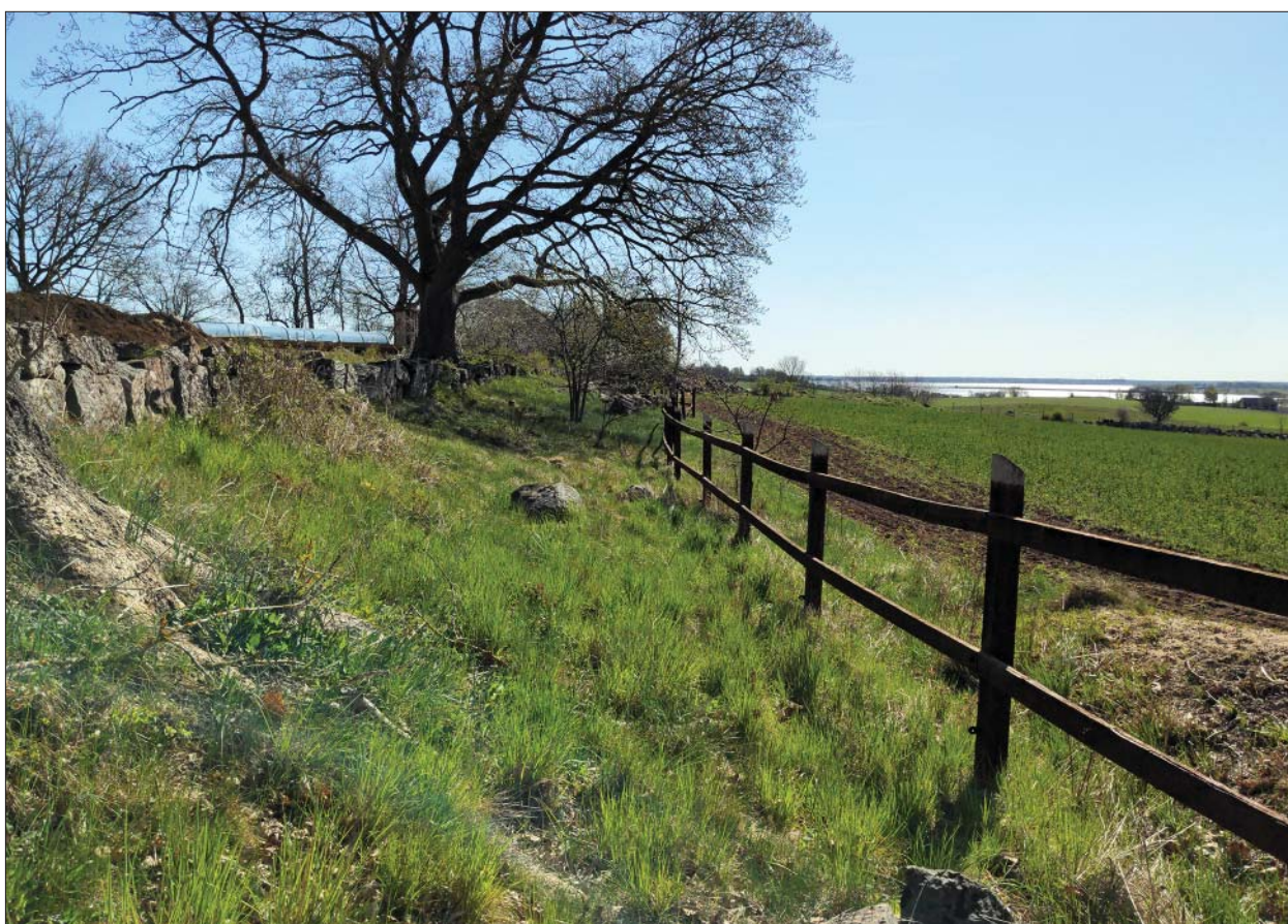
Figur 7. Terrassens stensatta ytterkant till vänster i bild. Foto mot öster, Roger Lundgren, ÖM.