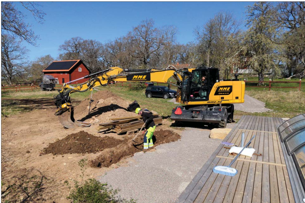
Figur 6. Schakt 217. Foto mot nordväst, Roger Lundgren, ÖM.