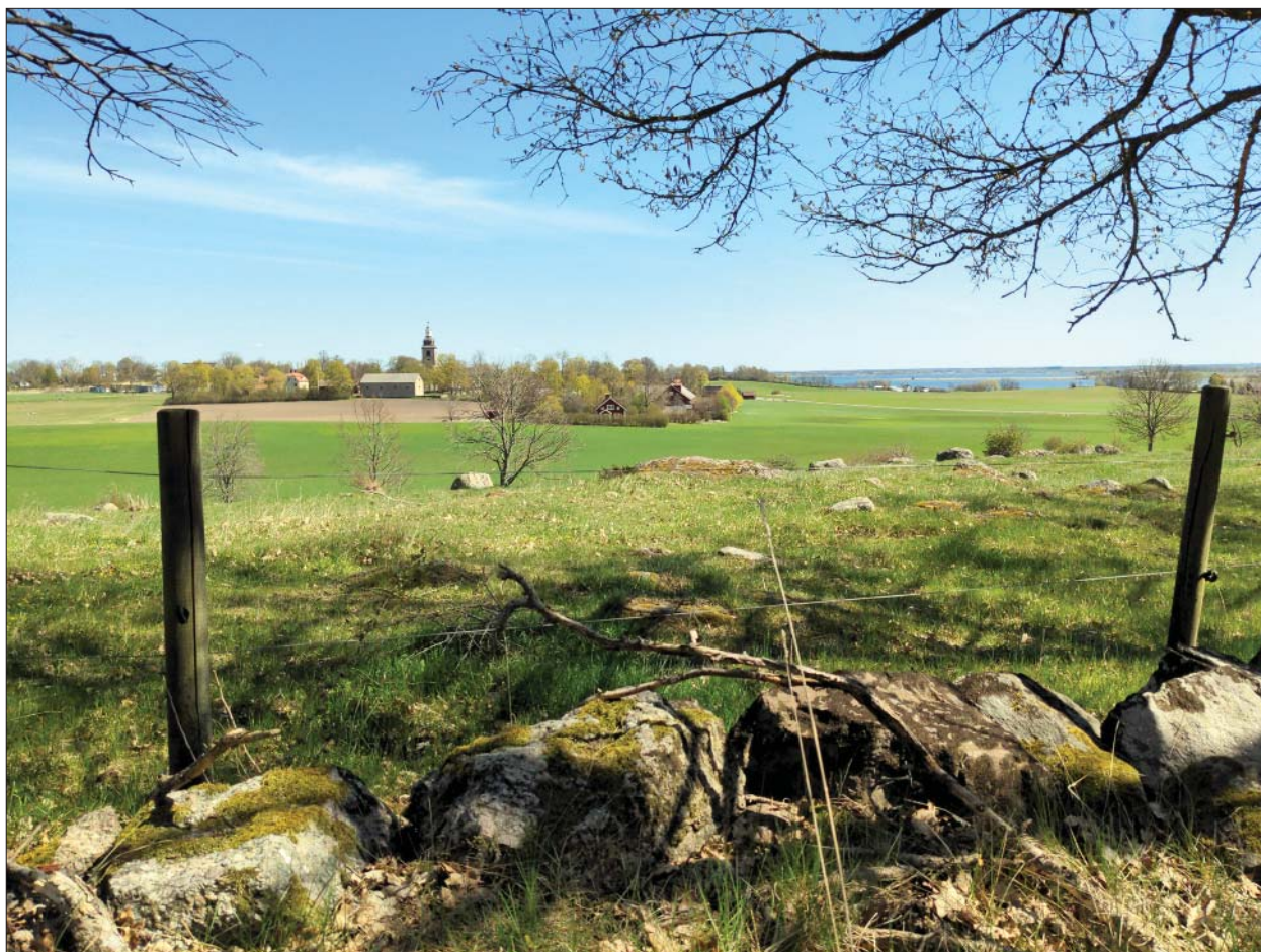
Figur 3. Gravfält L2010:8156 med Vreta klosterkyrka i bakgrunden. Foto mot öster, Roger Lundgren, ÖM.

Området kring Vreta kloster/Berg har åtminstone någon gång tillbaka i tiden utgjorts av en slags halvö med Motala ström i norr och en tidigare vik/våtmarksområde kring Svartån i söder. Hur markutnyttjandet förhöll sig mer exakt under järnålder är oklart men en möjlig ledtråd kan vara att äldre lämningar från järn- och bronsålder vanligen ligger på en något högre nivå än den nivå där exempelvis de huvudsakligen medeltida lämningarna vid Kungsbro återfinns. Dock bör förhållandet inte övertolkas då området som helhet har varit intensivt uppodlat sedan länge och att