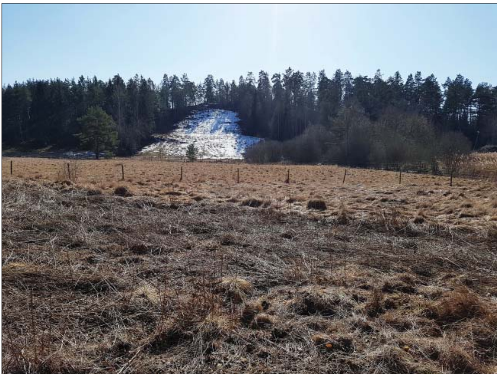
Vy mot södra delen, från norr. Skidbacken i bakgrunden.