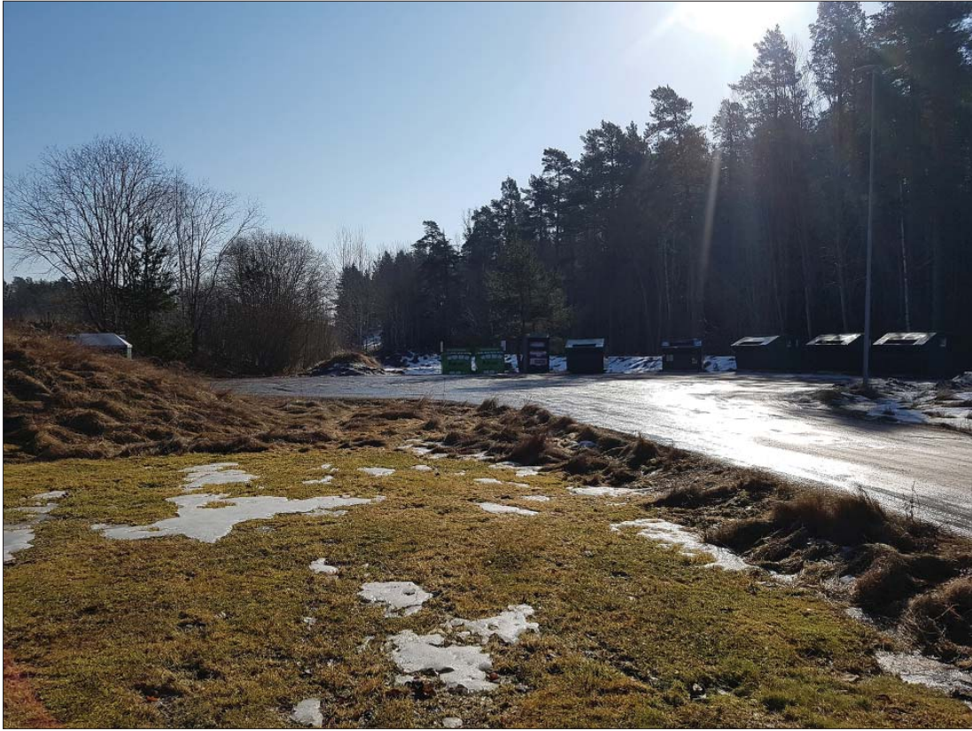
Återvinningsstation, från väster.