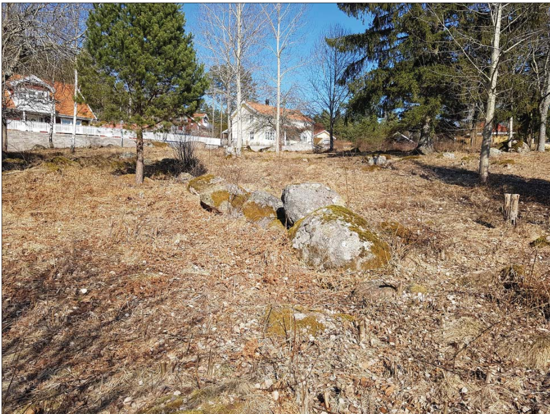
Möjligen stensträng L2012:2158. Foto från sydväst, Anders Olofsson, ÖM.