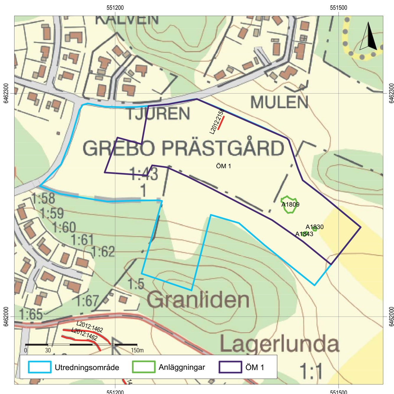
Figur 3. Utsnitt ur digitala Fastighetskartan. Utredningsområdet med påträffade och sedan tidigare kända lämningar samt föreslagen yta till arkeologisk utredning, etapp 2. Skala 1:3000.