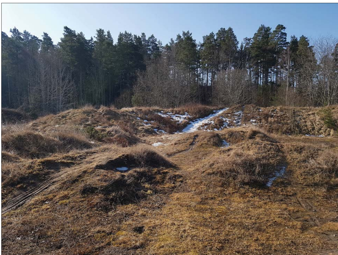
Cykelbana i västra delen, från norr.