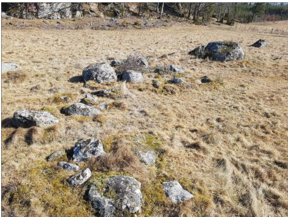
Detalj av A1809, från sydväst.