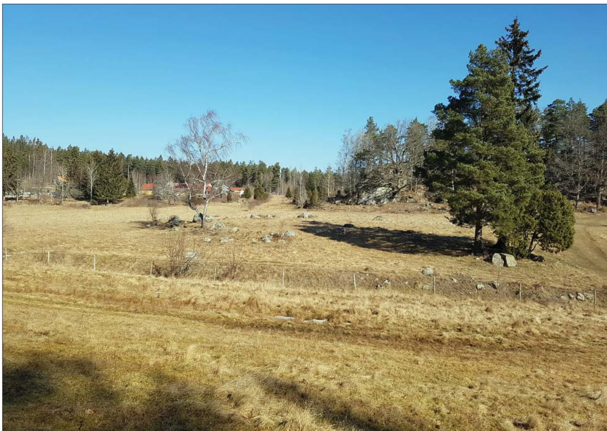
Figur 4. Östra delen, från söder. A1809 syns centralt i bilden.

i form av schaktningsövervakning i samband med VA-arbeten. Härvid påträffades bl a två kokgropar, varav den ena ^{14}\text{C} -daterades till äldre järnålder, 20 f Kr - 125 e Kr (Rönngren 2015).