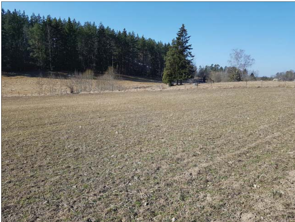
Östligaste delen, från öster.