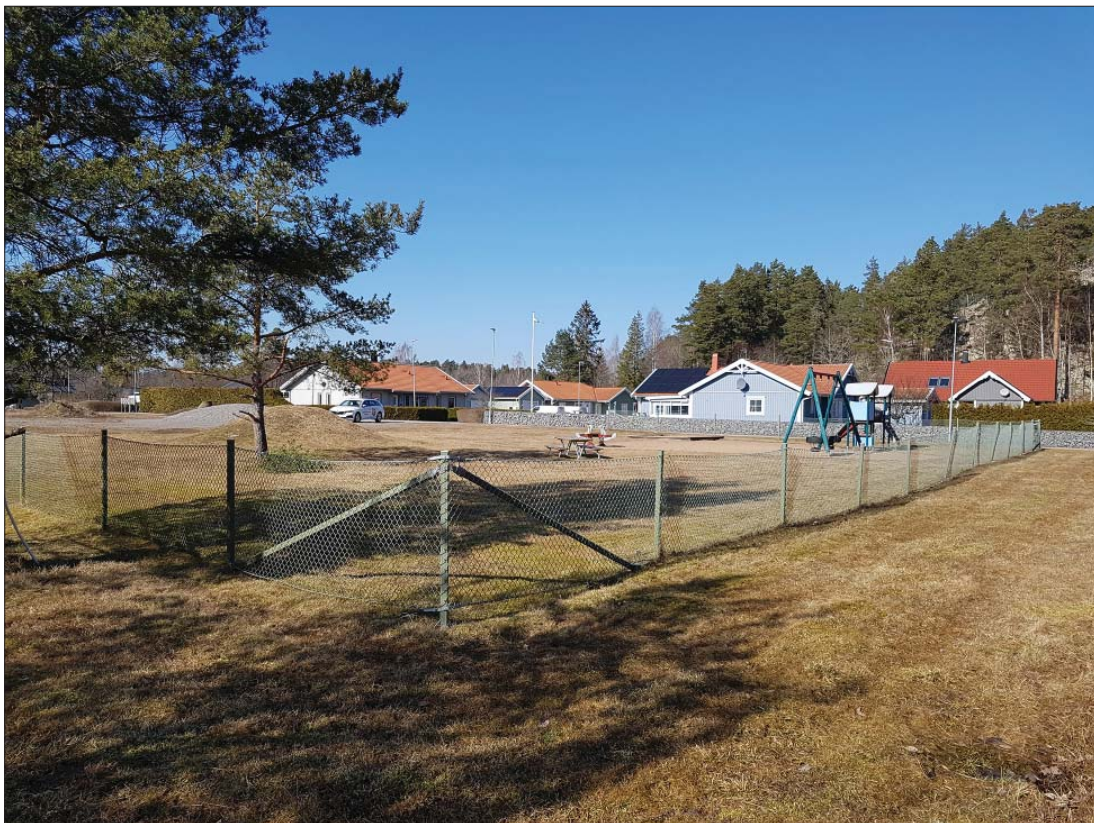
Lekparken i nordvästra delen av ytan, från sydöst.