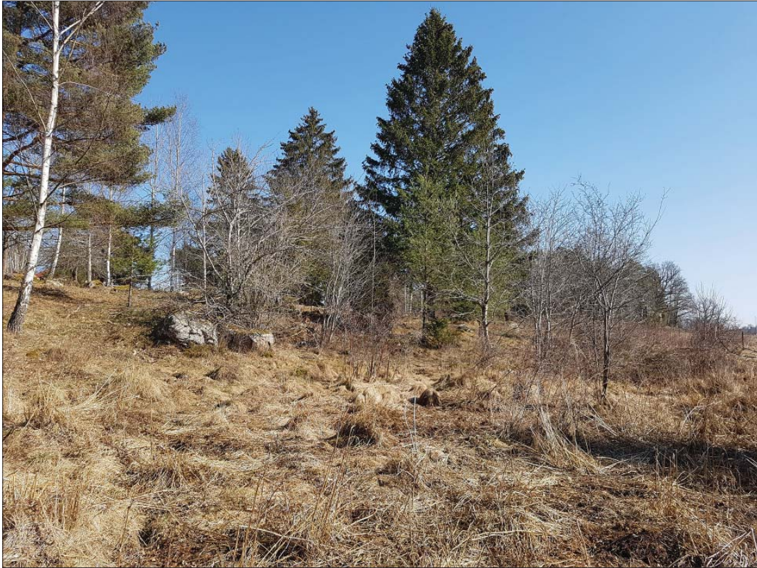
Norra delen, från väster.