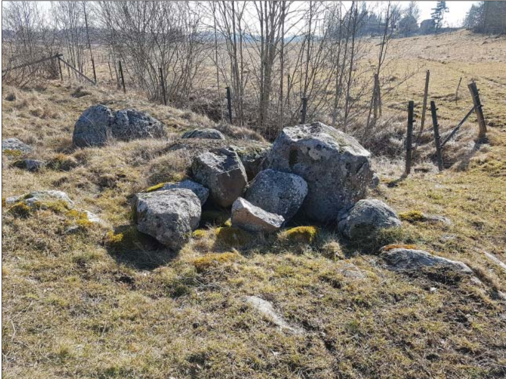
A1843, från nordväst.