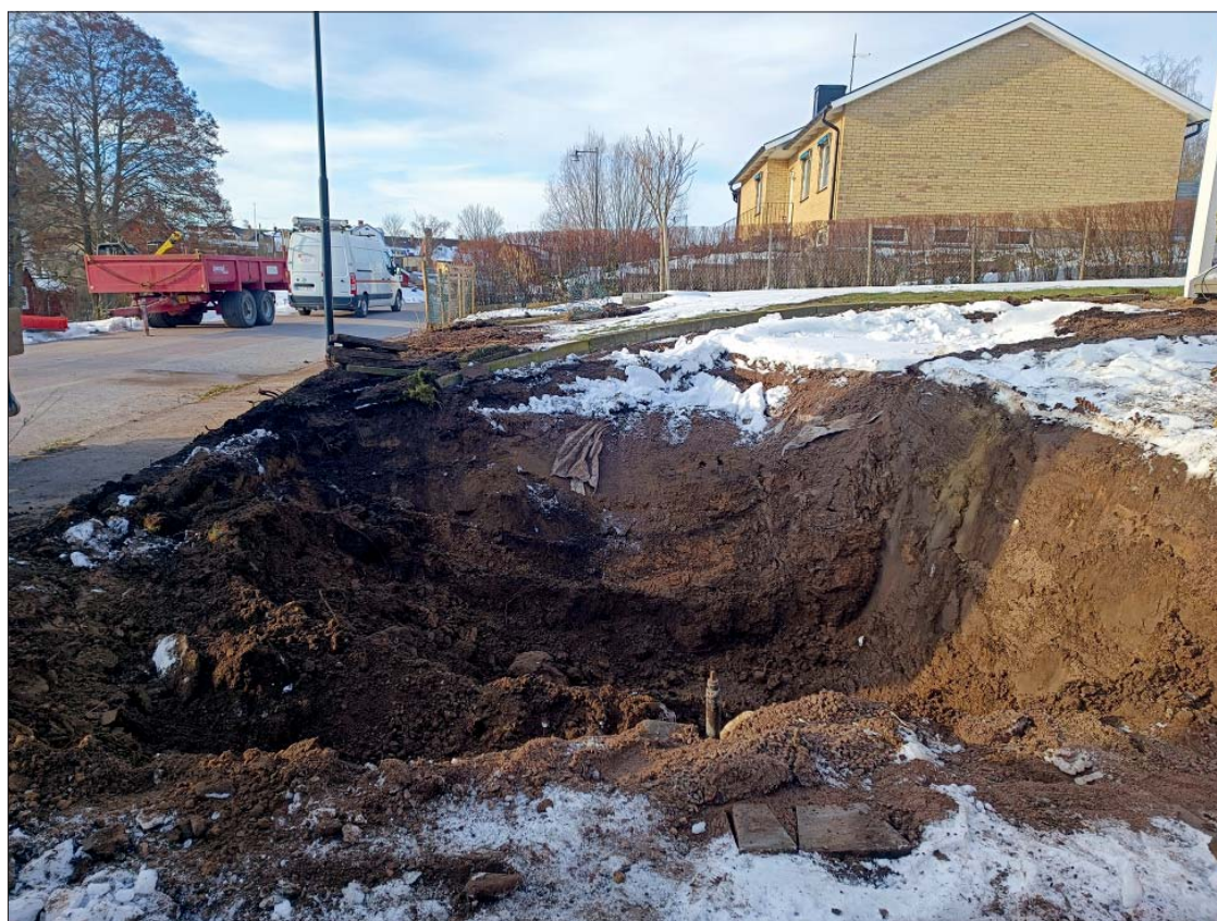
Figur 4. Schaktet innehöll inget av arkeologiskt intresse. Foto från norr, Helén Romedahl, ÖM.

Hasselmo, M. 1983. Skänninge . Medeltidsstaden 40. Riksantikvarieämbetet Statens historiska museer.