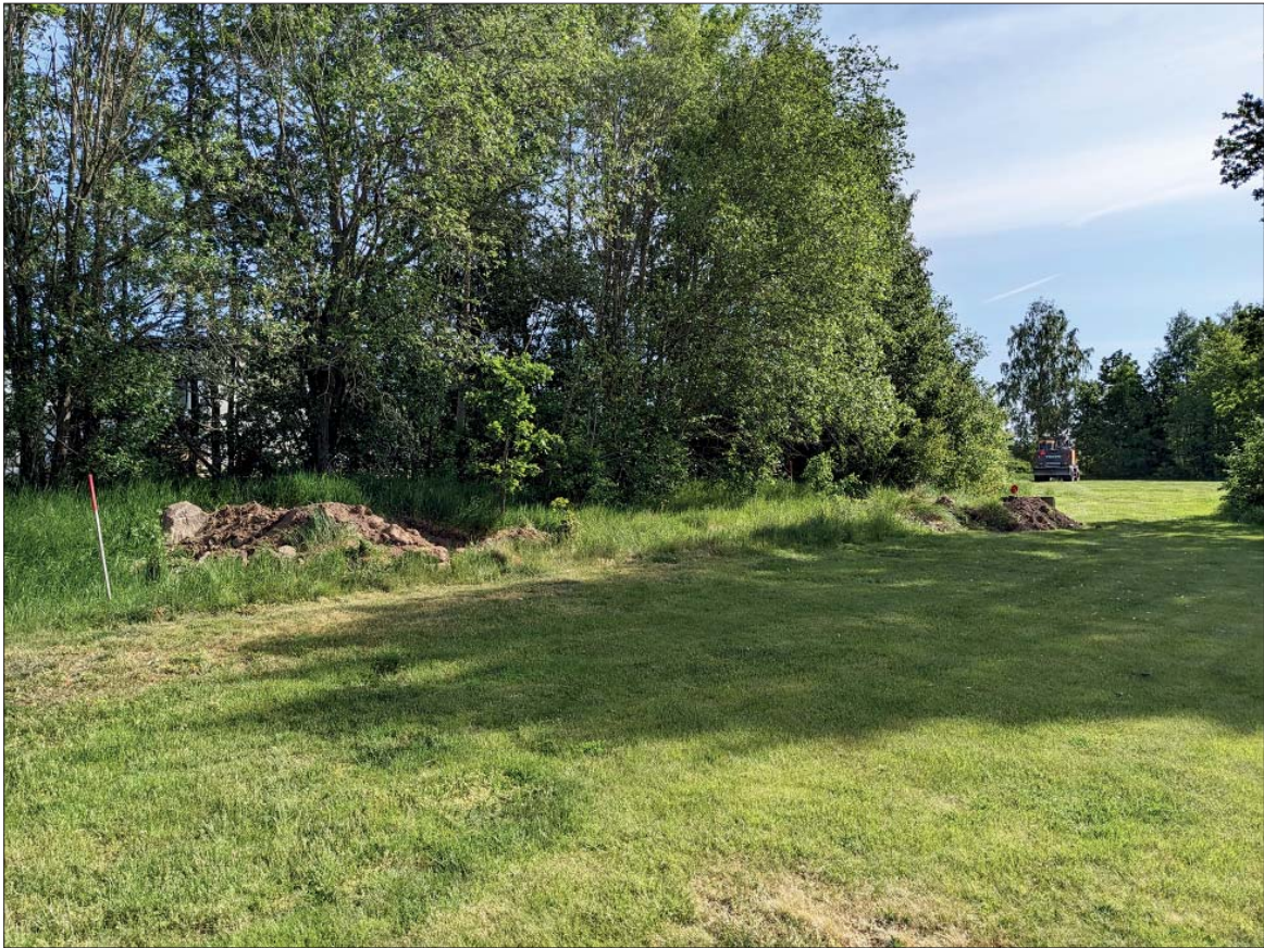
Figur 6. Undersökningsområdet mot nordost med schakt S274 till vänster i bild och S314 till höger.