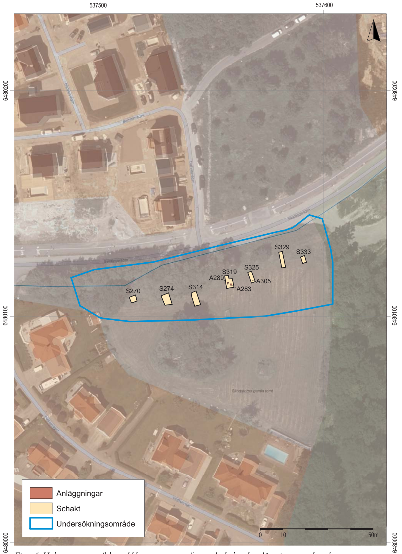
Figur 5. Utdrag ur topografiska webbkartan samt ortofoto med schakt och anläggningar markerade. Skala 1:1 000