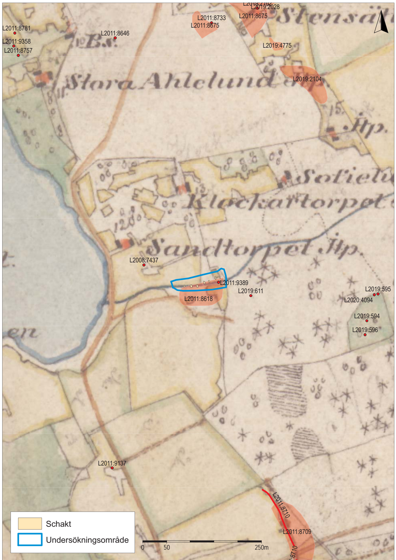
Figur 3. Rektifierat utsnitt ur Häradsekonomska kartan år 1868–77 med aktuellt undersökningsområde och schakt markerade. Skala 1:5 000.