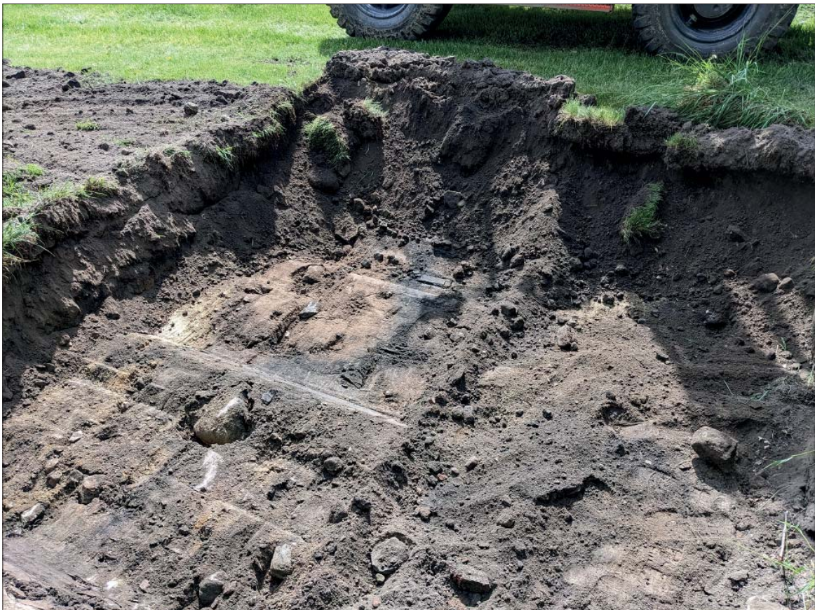
Figur 7. Kulturlagret i S319 under framschaktning. Foto mot SSO, Roger Lundgren, ÖM.