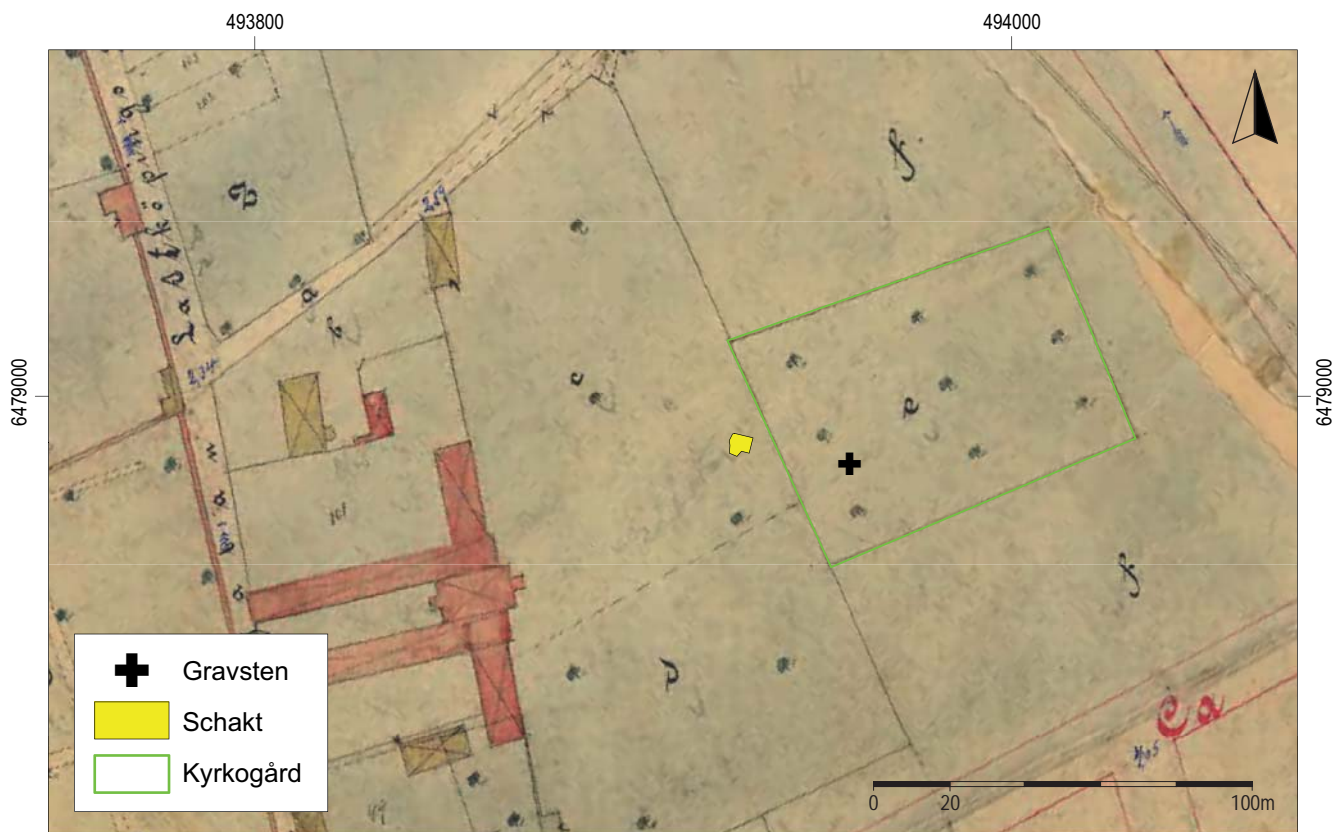
Figur 3. Rektifierad version av 1898 års karta över staden (LMM 05-vad-77) med det aktuella schaktet markerat. Den kvarvarande gravstenen över Wilhelm Gahne är markerad med svart symbol. Skala 1:2 000.

Fyndplatsen bedöms vara mycket nära det aktuella schaktningsarbetet.