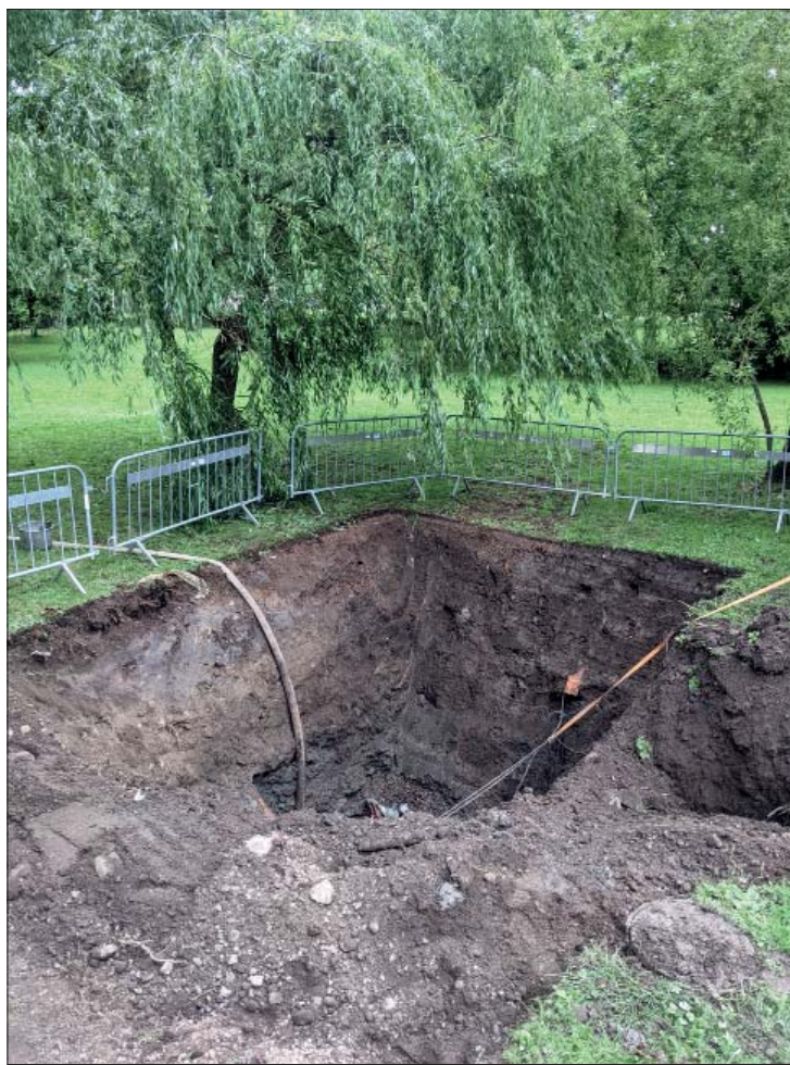
Figur 4. Det aktuella schaktet sett mot sydost.