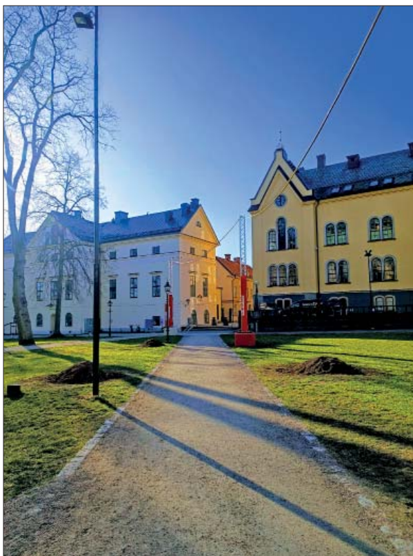
Figur 5. Schakten söder om domkyrkan. Foto mot S, Helén Romedahl, ÖM.