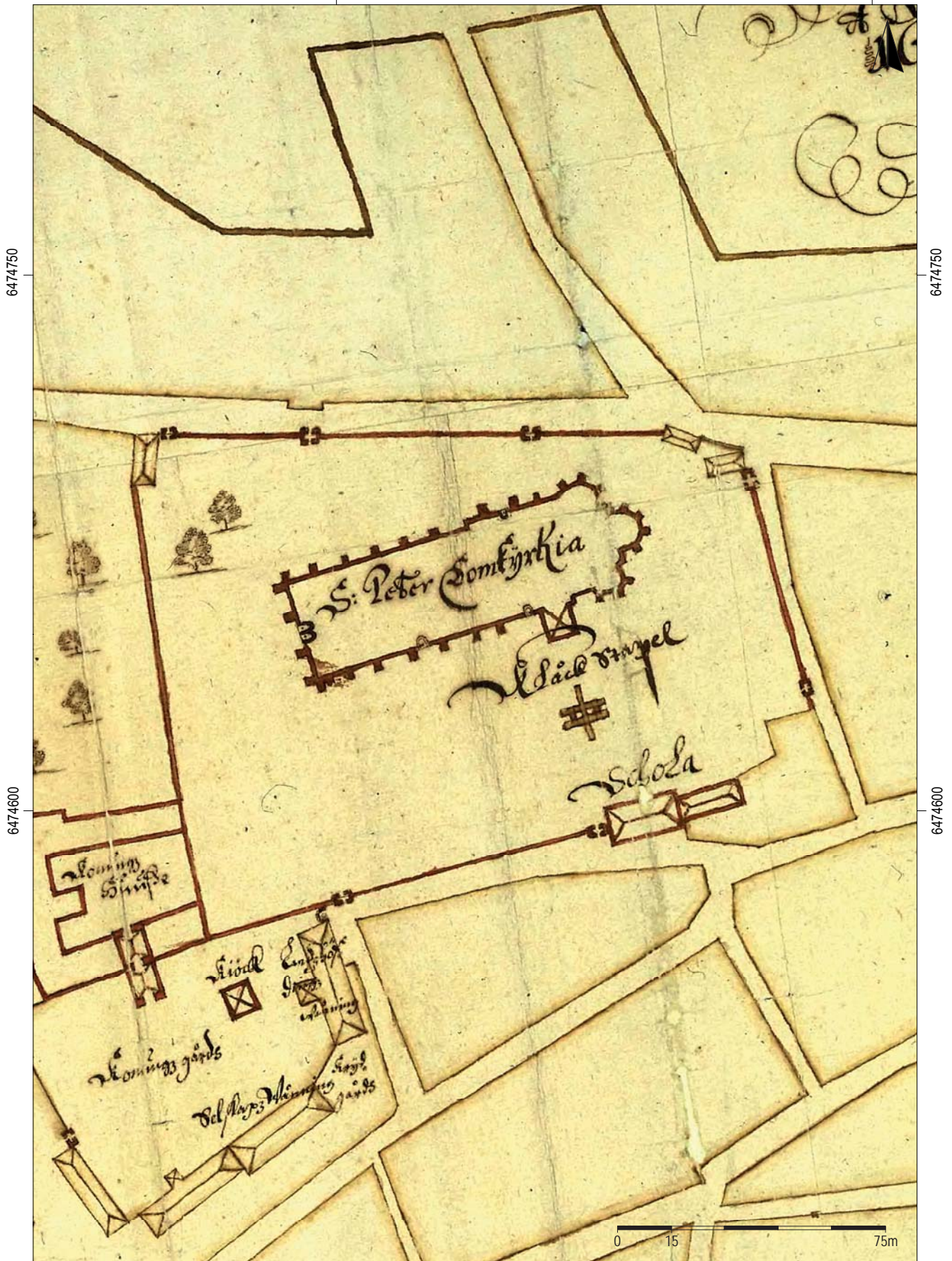
Figur 3. På 1651 års stadskarta illustreras den bogårdsmur (samt de sju stigluckorna) som omgav det som då var en kyrkogård. Här syns även det klocktorn som revs under 1700-talets mitt. Skala 1:1 500.