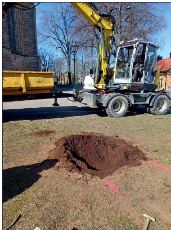
Figur 6. Schaktet öster om domkyrkan. Foto mot V, Helén Romedahl, ÖM.

Den arkeologiska undersökningen genomfördes som en schaktningsövervakning. Schakten mättes in och beskrevs och fotografier togs. Dokumentationsmaterialet förvaras på Östergötlands museum.