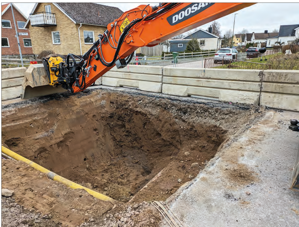
Figur 4. Schaktet sett från norr med Sankta Ingrid's väg i bakgrunden till höger i bild.

Tillsammans med tidigare utförda undersökningar visar resultatet på den omfattande graden av sentida urschaktning i Nunnestigen. Dock har det i samband med några undersökningar (t ex Magnusson 2008) framkommit lämningar även i gatumark i Nunnestigen.