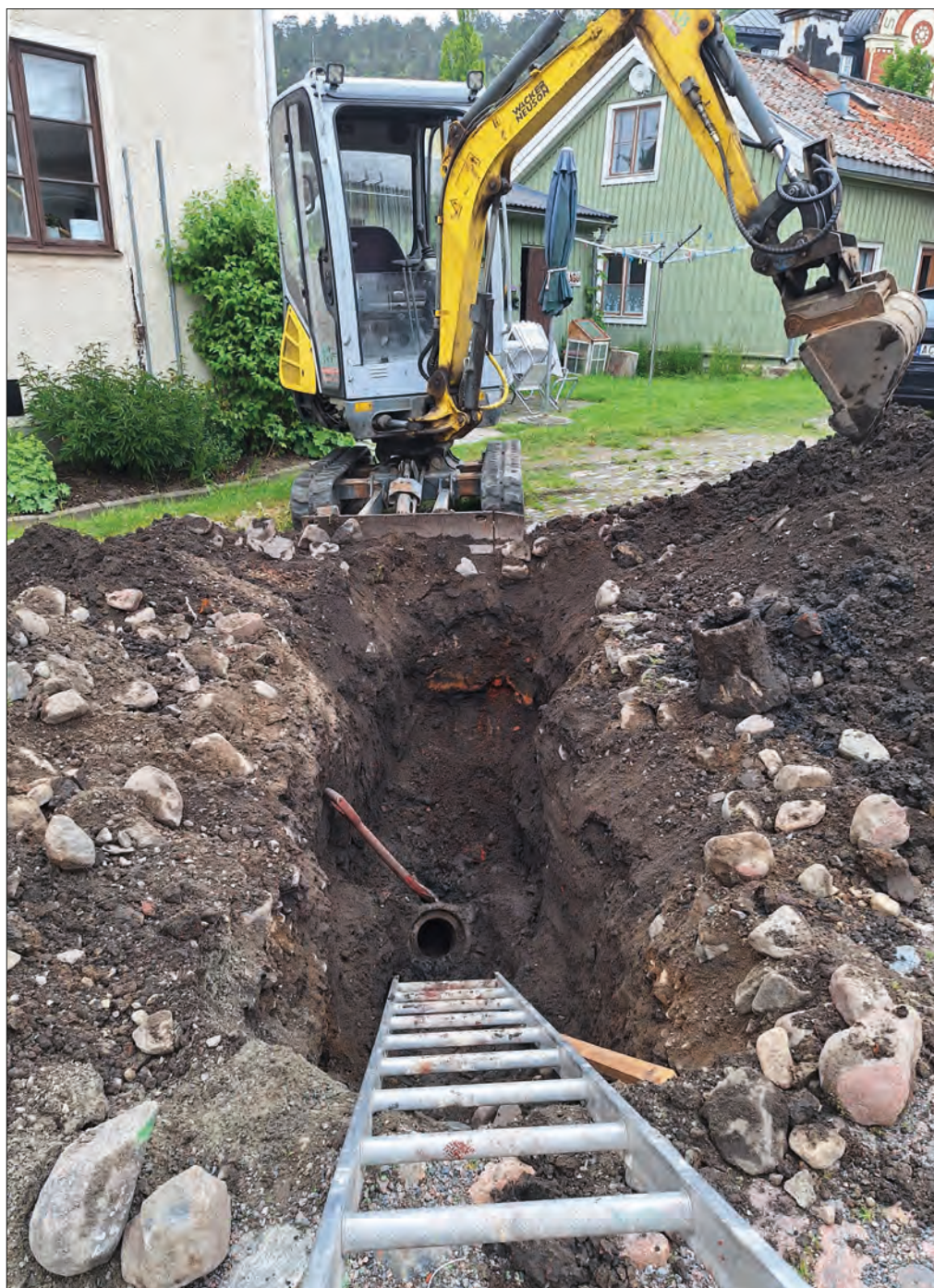
Figur 4. Schaktet med det trasiga avloppsroret. Längst bort i schaktkanten syns spår efter ett brandlager. Foto mot NNÖ, Helén Romedahl, ÖM.

Schaktet mätte ca 3 x 1 m och grävdes till ett djup om som mest 0,9 m. I huvudsak följdes den gamla rörgraven och schaktet utgjordes därför till största del av omrörd och återfylld jord. I de omrörda massorna syntes bla fragment av tegel, sten, kalkbruk och djurben. Inom ett kortare parti, i schaktets norra del, berördes intakta kulturlager. Dessa utgjordes av ett ca 0,3 m tjockt brand-/raseringslager samt ett därpå följande lager med grå homogen lera. Kulturlagernivån vidtog på ca 0,3–0,4 m djup under dagens gårdsplan.